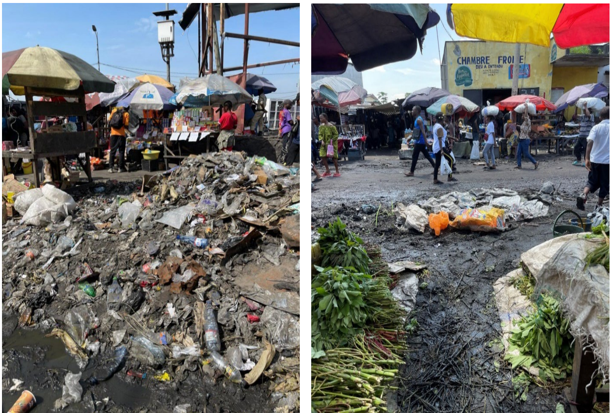
Figures 2 et 3: Vues panoramiques actuelles du Marché de Matete