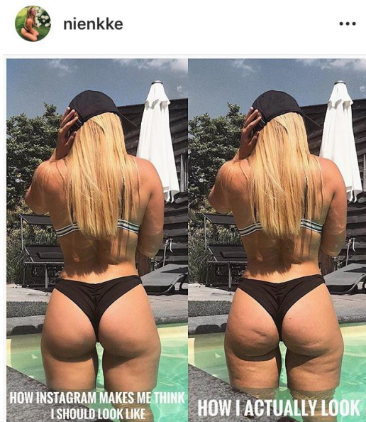
Figure 1: Photo avant/après sa modification

font aussi la promotion de procédures esthétiques sur les réseaux sociaux telles que les traitements contre la cellulite, pour la réduction de matière grasse, pour l'augmentation des