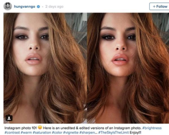
Figure 3: Selena Gomez, selfie avant/après editing

( editing ) (exemple à la figure 3) et leur partage sur les réseaux sociaux (Svelander & Wiberg, 2015). Le matériel nécessaire pour la pratique de selfies inclut un téléphone intelligent ainsi qu'une plateforme de réseau social (Svelander & Wiberg, 2015). La publication de selfies permet aux usagères d'exprimer leur personnalité, leur style de vie et leurs