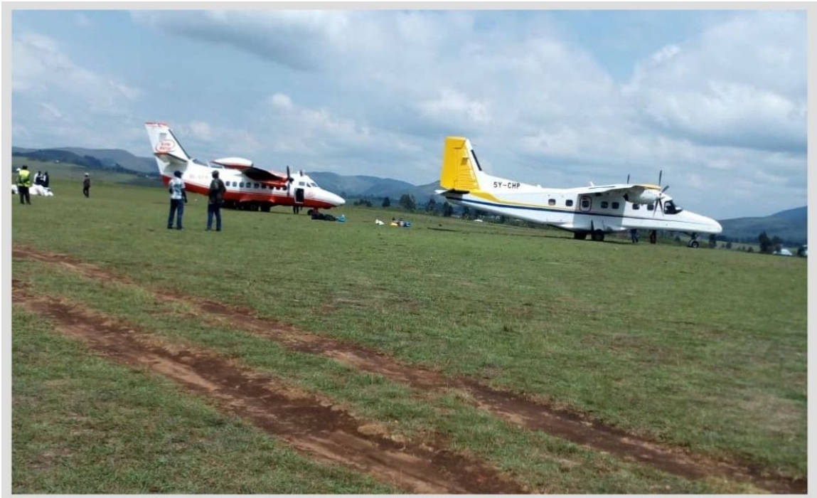
Figure 5. Aéroport Gisaro de Minembwe