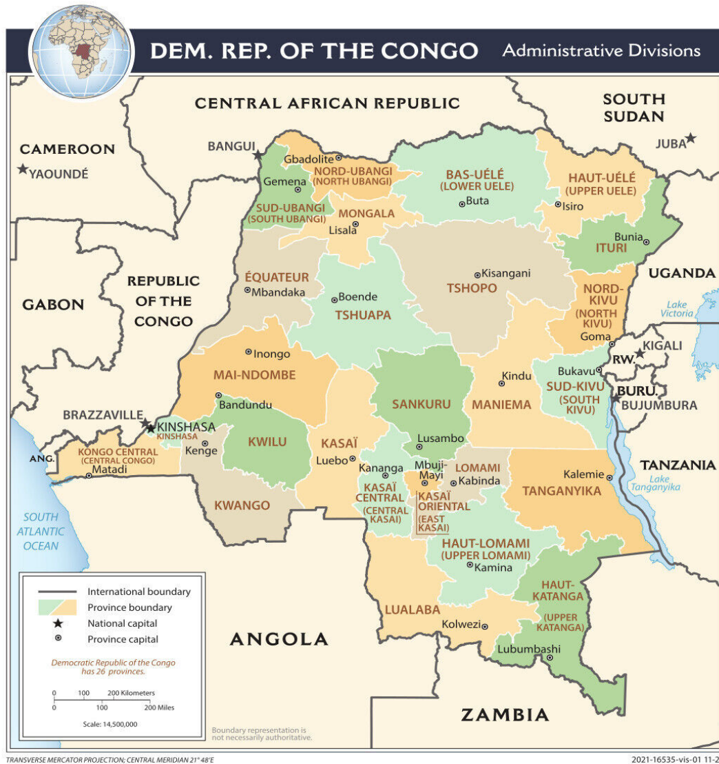
Figure 1. Carte de la République démocratique du Congo