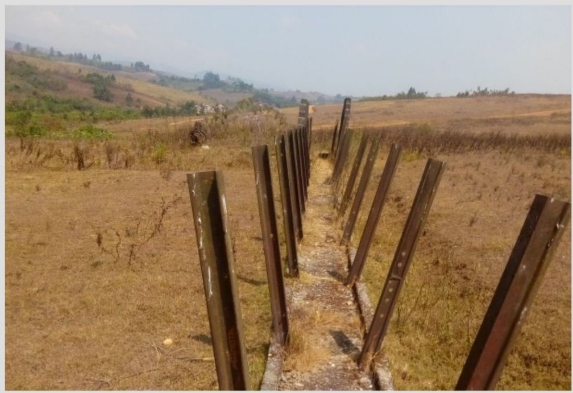
Figure 3. Un terrain et des barres de fer présentés comme les vestiges d'une ferme coloniale à Minembwe dans le territoire de Fizi.