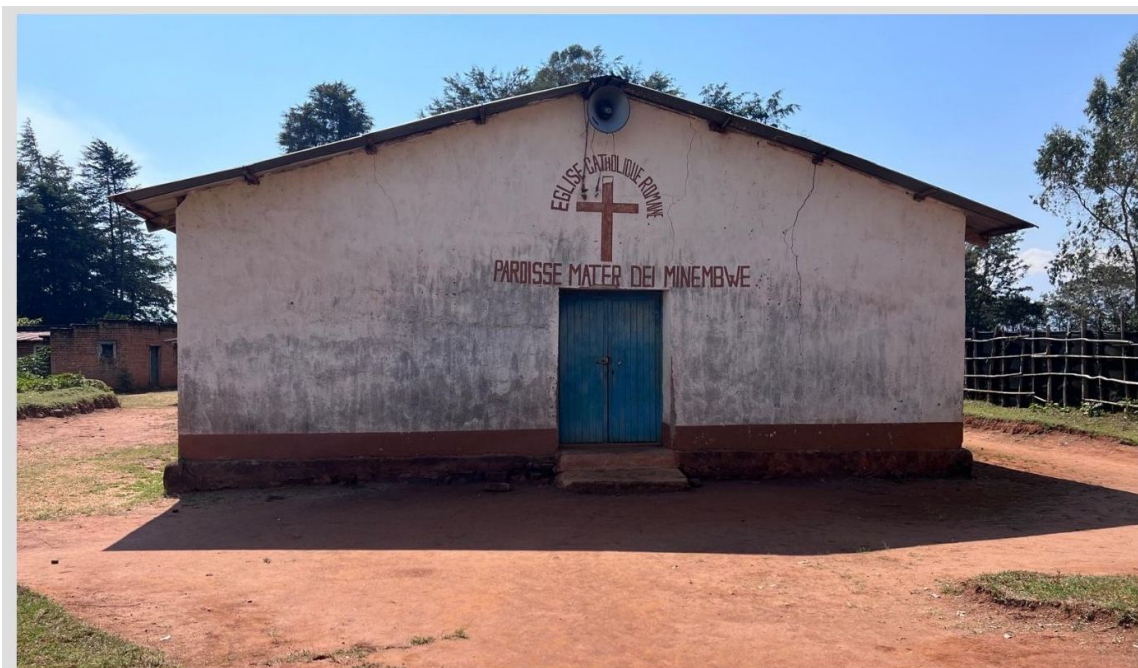
Figure 4. La Paroisse Mater de l'Église catholique à Minembwe