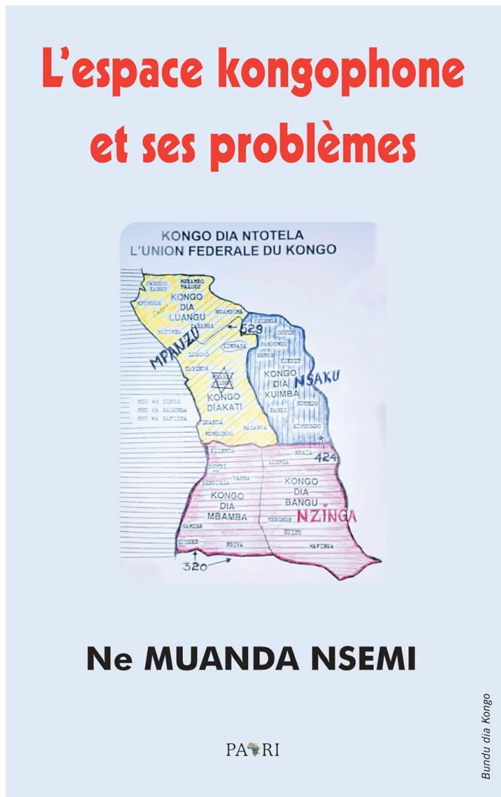
Figure 6. Carte du potentiel État Kongo représentée sur le livre de Ne Muanda Nsemi

On peut y apercevoir une carte supposée représenter ce pays tant convoité, le Kongo Dia Ntotela , l'Union fédérale du Kongo, et ses quatre États fédérés : Mpanzu, Nsaku, Nzinga et Kongo Dia Mbamba. Le lecteur aura identifié dans cette liste les trois ancêtres kongo qui composent les trois premiers États proposés.