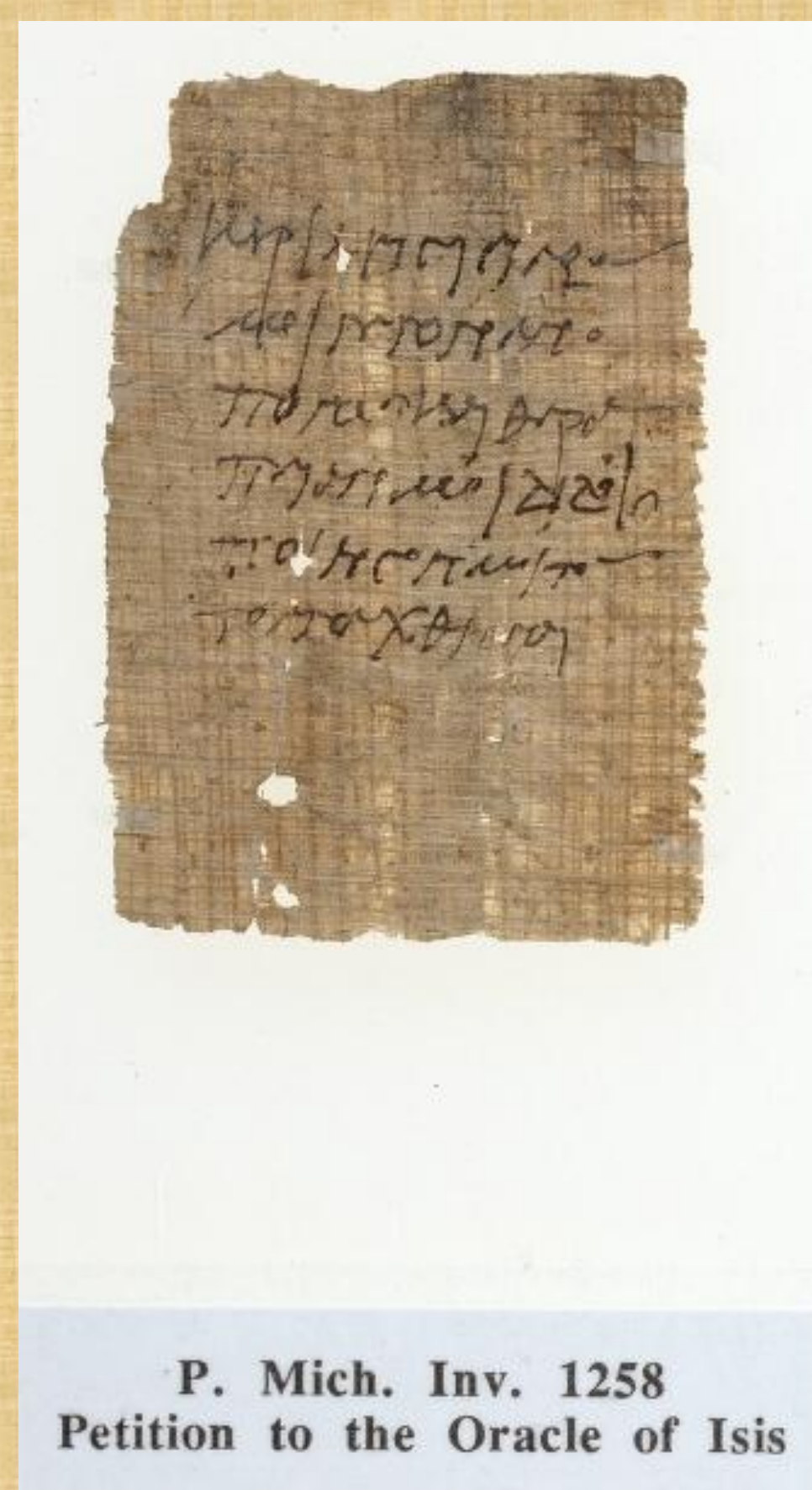
P. Mich. Inv. 1258 Petition to the Oracle of Isis