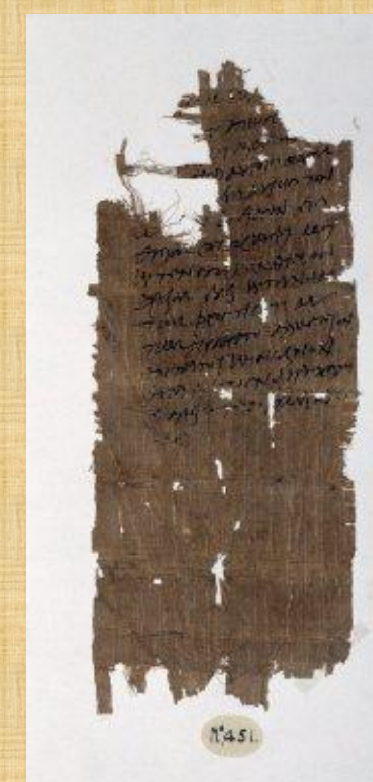
P. Oxy. 6 923 Petition to the oracle of Zeus-Helios-Serapis