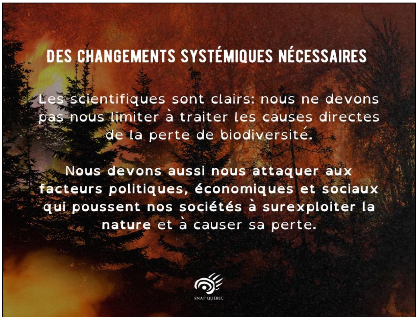
Figure 6. Injonctions pour éteindre le feu.

Pendant que je flânais sur les réseaux sociaux durant l'écriture de cette conclusion, l'algorithme a présenté sur mon fil d'actualité cette publication commanditée de la part de la SNAP Québec, l'organisation sœur de la SNAP-VO 31 :