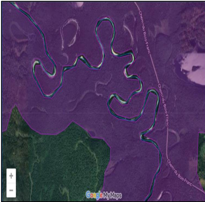
Figure 3. Cartographie de l'exclusion, versant Noire.

conservation en tête, le legs de cette association passe sous silence : les rivières sont exclues des frontières de l'aire protégée, exclues du régime de protection garanti par le statut octroyé.