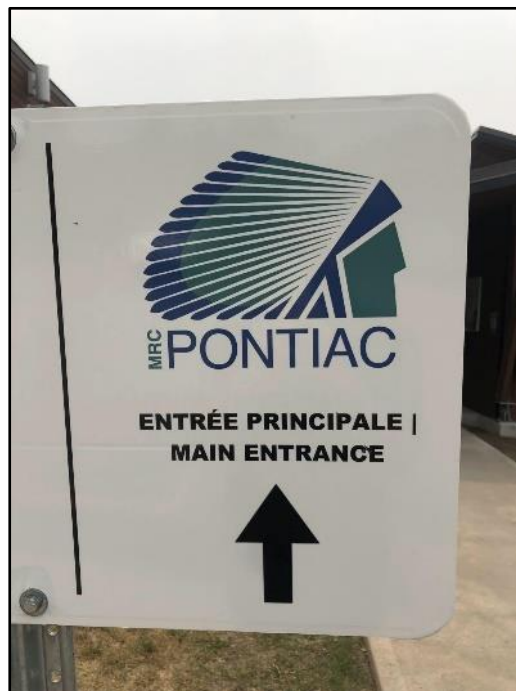
Figure 5. Iconographie de la réappropriation et manifestations du pouvoir administratif municipal en territoire anishinaabeg non-cédé.