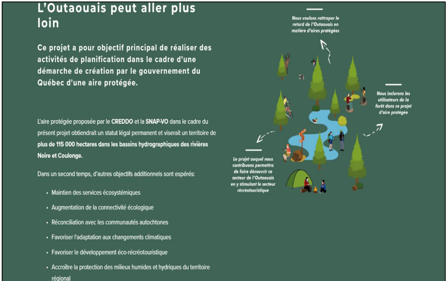
Figure 1. Promesses de conservation.

conservation. Dans le cas du Pontiac, il s'agit d'une manière que l'Outaouais « aille plus loin », comme l'indique ce graphique de présentation du projet :