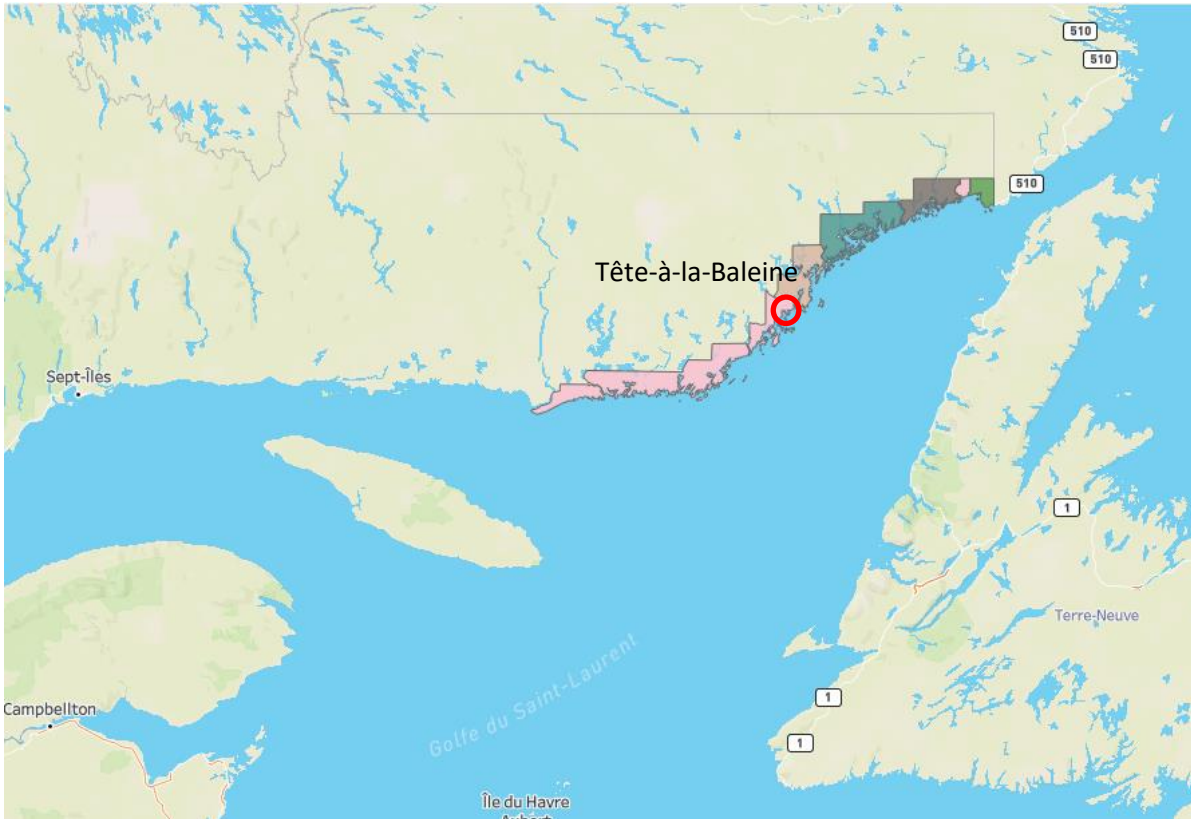
Figure 3 - Carte de la MRC du Golfe-du-Saint-Laurent, de ses municipalités et du village de Tête-à-la-Baleine

Sources : OpenStreetMap et Données géographiques de Statistique Canada (2016).