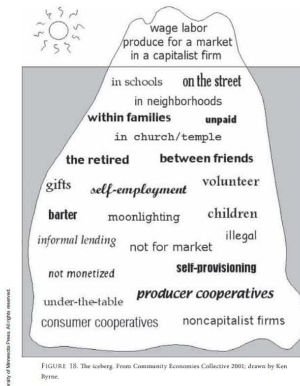
Figure 2 - L'iceberg des économies diverses

communauté, qu'elles soient capitalistes ou relatives à une économie alternative au capitalisme 2 . En prenant conscience de la diversité des activités économiques, il est possible de voir une foule de pratiques, notamment celles relatives à la reproduction sociale qui générerait ainsi une certaine forme de développement (Gibson-Graham, 2006). Il semble que cette approche soit particulièrement intéressante pour mieux saisir les activités qui se déroulent au sein d'une communauté souvent perçue comme vulnérable et dont l'économie de marché est limitée. L'image de l'iceberg utilisé par Gibson-Graham permet de mieux visualiser l'ampleur que peut avoir les économies alternatives au capitalisme dans une communauté (figure 2).