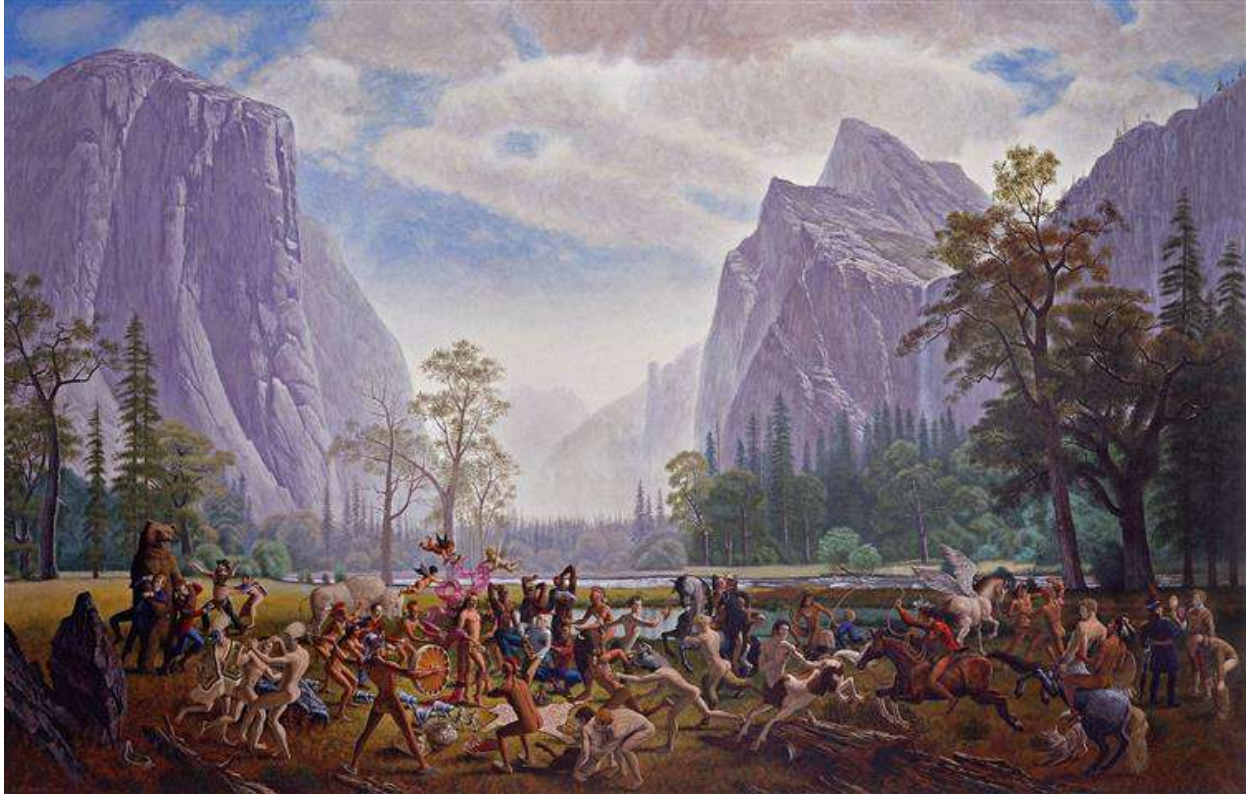
Fig. 1. The Triumph of Mischief (2007)

personnages participent à des actes sexuels et, au centre, nous retrouvons l'un des personnages centraux aux œuvres de Monkman – Miss Chief. Comme le décrit le Musée des Beaux-Arts :