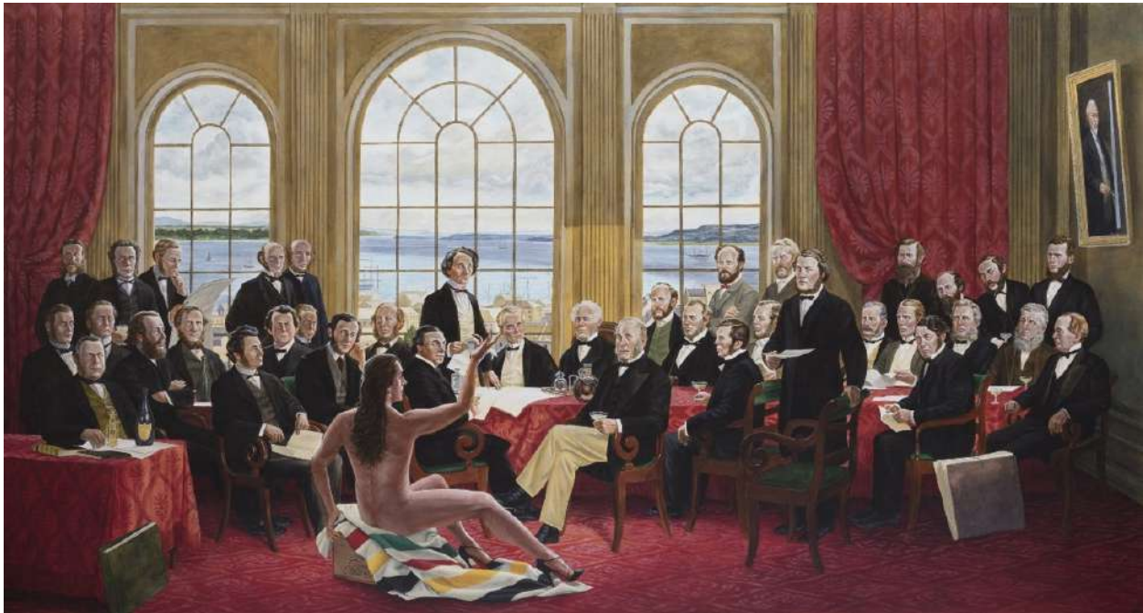
Fig. 2. The Daddies (2016)

couchée sur une couverture. Dans la peinture originale, cette couverture est un simple beige, mais dans le cas présent, c'est une couverture iconique rayée de la Compagnie de la Baie d'Hudson. Ici, nous voyons plus spécifiquement une représentation des peuples autochtones au sein de la société canadienne, toujours en conservant la touche comique pour laquelle Monkman est connu. Autour de Miss Chief se trouve le groupe de 37 délégués de la Conférence de Québec de 1864 qui regardent Miss Chief avec des yeux bleus perçants, presque animaliers (Wikiart).