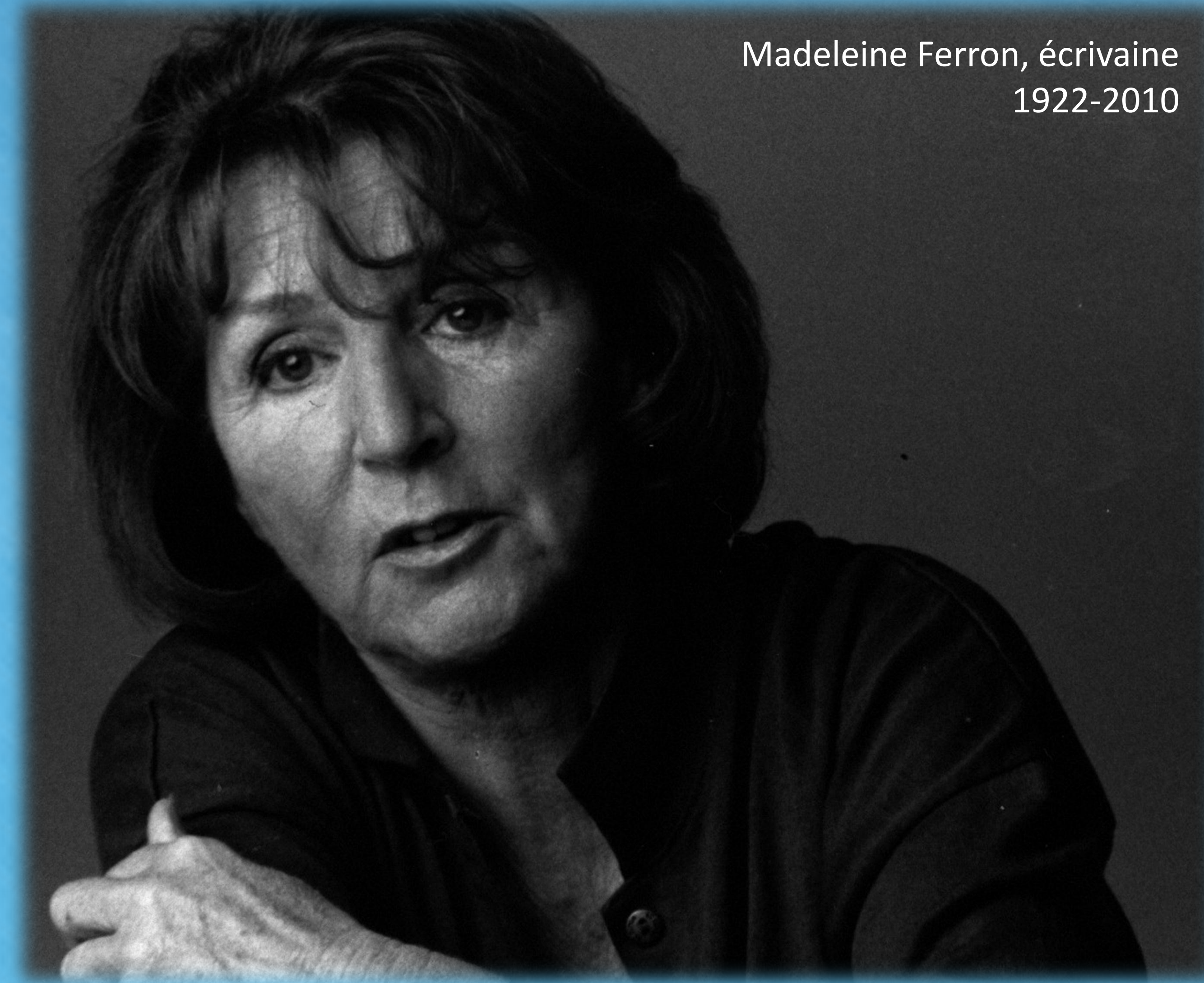
Madeleine Ferron, écrivaine 1922-2010

Suite à la lecture d'un manuscrit de Madeleine Ferron, éminente écrivaine québécoise, différents éléments ont porté à croire que plusieurs passages de ce cahier inédit ont été publiés sous la forme d'histoires dans la revue L'Information médicale et paramédicale , publication médicale à laquelle se mêlait l'insertion de créations littéraires, dont les histoires de Ferron. Certaines de ces histoires sont par la suite devenues des contes, des nouvelles ou encore des chapitres de romans selon certains procédés de réécriture. Afin de mieux comprendre la genèse de l'œuvre de Madeleine Ferron, il était essentiel de vérifier cette hypothèse en analysant plus en détails les liens unissant le manuscrit, équivalant à plus de quatre-vingt-dix pages typographiées et devenu disponible à la recherche par un hasard inouï, et les premières publications littéraires de Madeleine Ferron : les histoires.