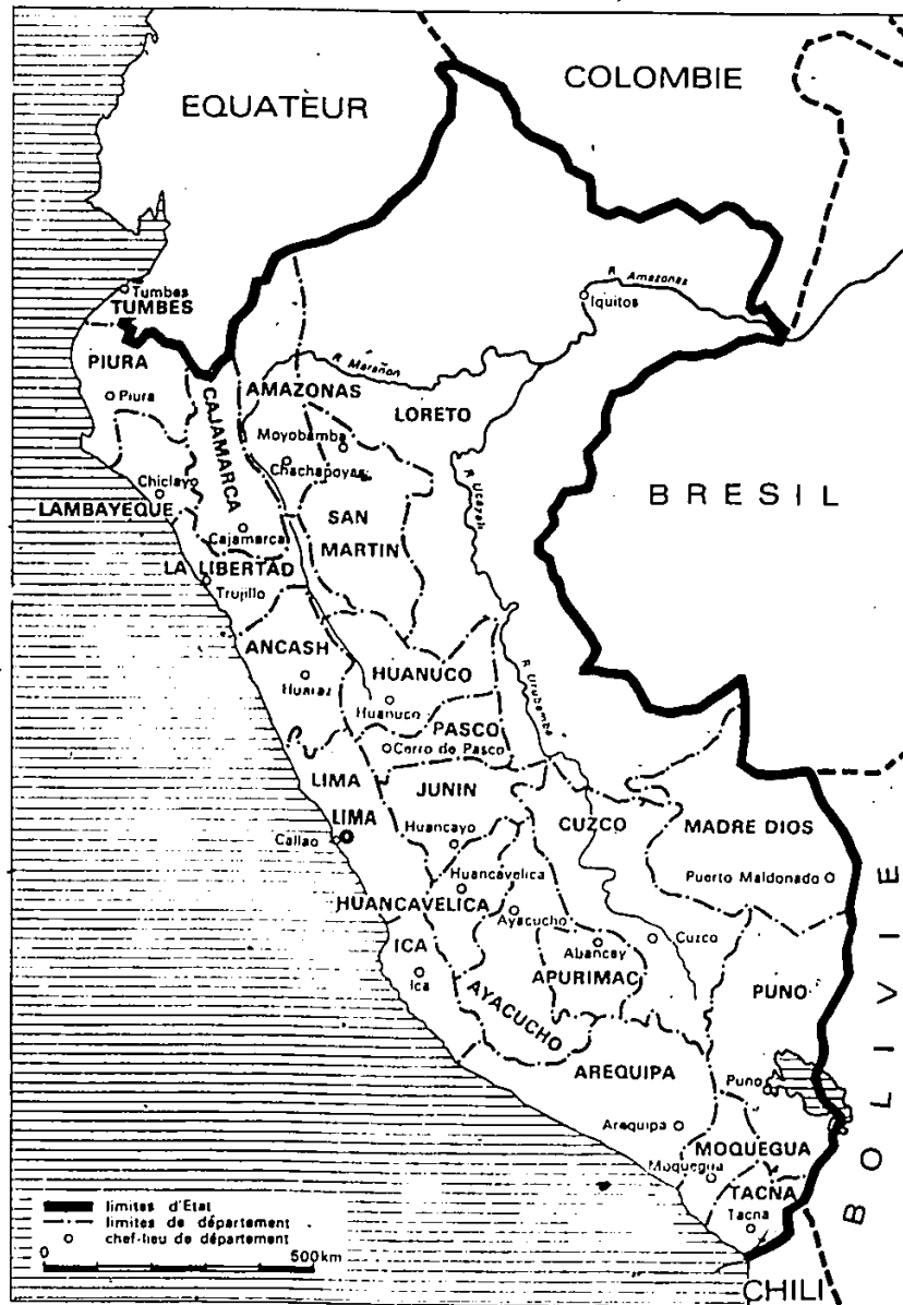
Pérou: divisions administratives.