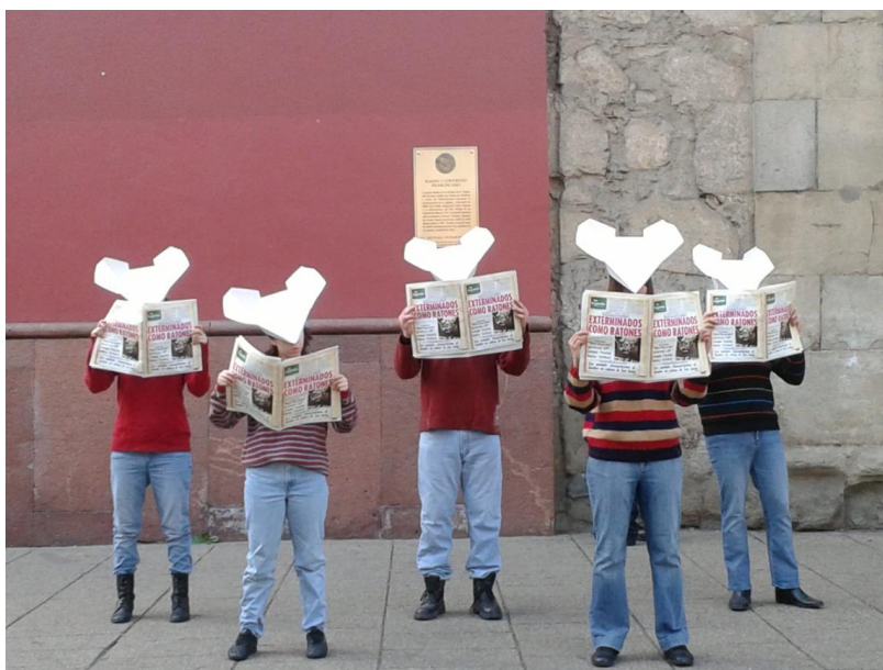
Figure 5 Performance de rue Exterminados como ratones

Le mois précédent, un autre événement performatif avait émergé de la collaboration entre le centre Hemispheric 279 et Londres 38 . Au cours de la journée du 21 juillet 2016, des performances se sont produites dans plusieurs lieux mémoriels de Santiago 280 . J'ai participé en tant qu'observatrice à la journée et la performance qui s'est avérée la plus frappante, selon moi, est la suivante.