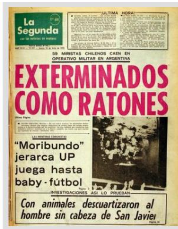
Figure 6 La Segunda 24/7/1975

Exterminados como ratones (Exterminés comme des souris) est le titre d'une couverture du journal La Segunda (24/7/1975) qui se réfère à l'assassinat de 119 Chiliens en Argentine au cours d'une opération concertée des forces militaires en marque de l'opération Colombo. La performance du groupe a débuté face au bâtiment situé au 38 rue Londres, puis s'est déplacée en faisant des pauses de cinq à dix minutes, temps qui est occupé par les « souris » à la lecture de leur journal annonçant l'extermination d'individus 281 . Leur performance s'est terminée face à La Moneda . Des membres du public ont alors entonné un chant historique qui rappelle la présence de groupes ou de victimes de la dictature dans l'espace public. Cet appel va ainsi : « ¡Allende, Presente! ¡Agrupación de familiares de detenidos desaparecidos, Presente! La valeur symbolique de l'événement a été augmentée par cette participation des regroupements de familles, du moins de certains de leurs représentants, qui ont au fil des activités ajouté à l'ambiance. Si on revient à Exterminados como ratones , les « souris » qui lisent les journaux représentent des citoyens « ordinaires » prenant compte du brutal assassinat de d'autres citoyens « ordinaires » qui avaient quitté le pays et qui par leur absence ne constituaient pas des menaces du régime à proprement parler. L'utilisation de la «