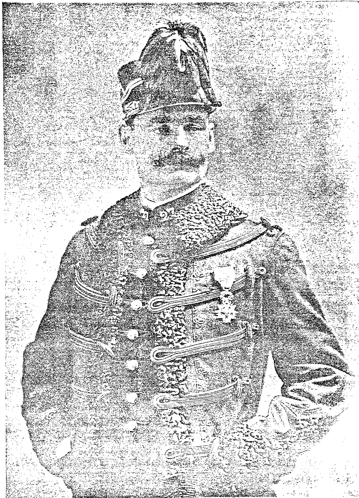
Chabran Lieutenant de Chassours Alpins Menton, France