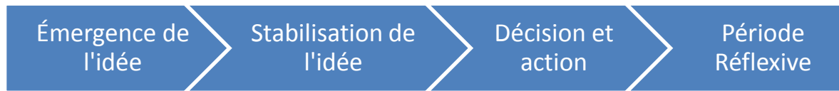
Figure 1 – Mise en rétrospection au sein de la structure de nos entretiens.

Dans la deuxième phase de l’entretien, une fois la période de remise en contexte terminée, le chercheur visait à cerner les obstacles et les adjuvants perçus par le participant lorsque l’idée de commettre un acte criminel se stabilise dans son esprit, voire devient omniprésente. Nous l’avons nommée la stabilisation de l’idée, phase où le processus décisionnel s’opère, où l’individu « réfléchissait » à ses possibilités. En d’autres termes, c’est la période où l’appréciation des conséquences et des bénéfices prend place, c’est à ce moment que peut se manifester la rationalité coûts/bénéfices, la rationalité du risque ou toute autre type de rationalité.