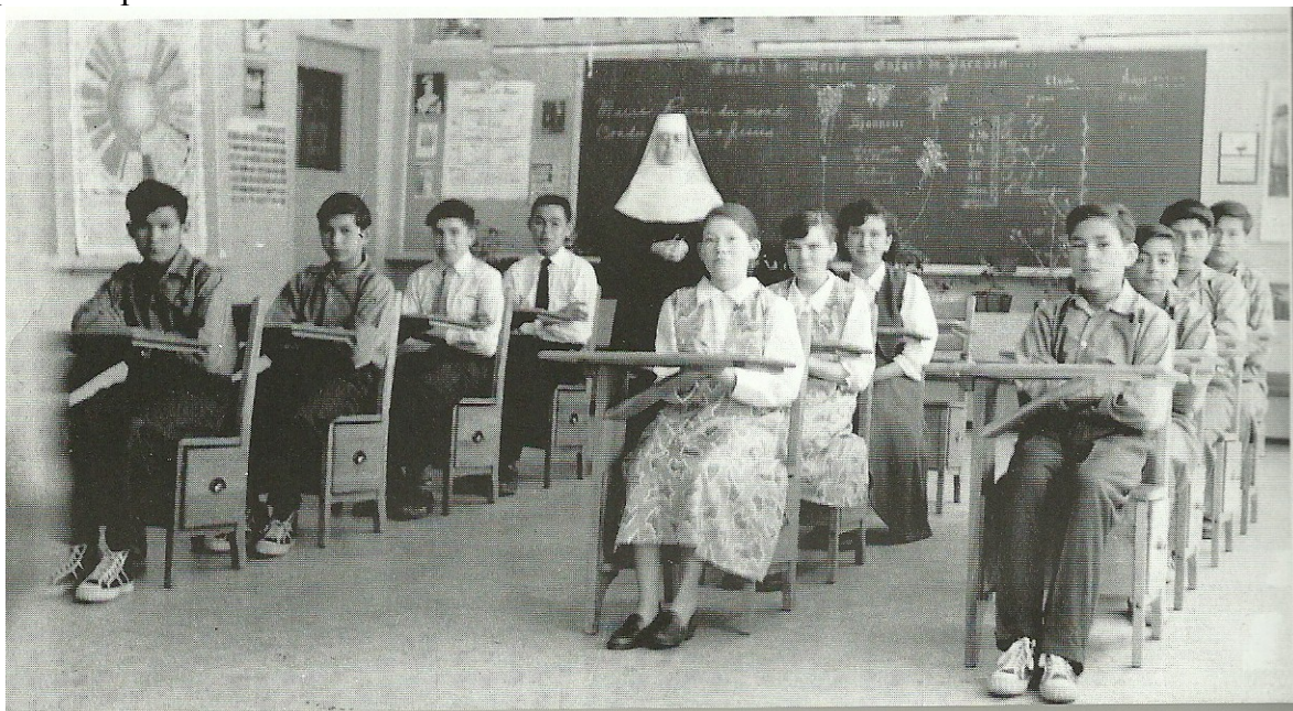
Salle de classe : Ottawa, Gilles. « Les pensionnats indiens au Québec : un double regard ». Québec, Éditions Cornac, 2010, p. 88.