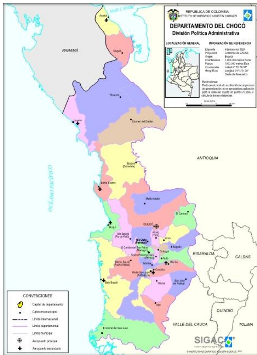
Figure 3 Carte département du Choco