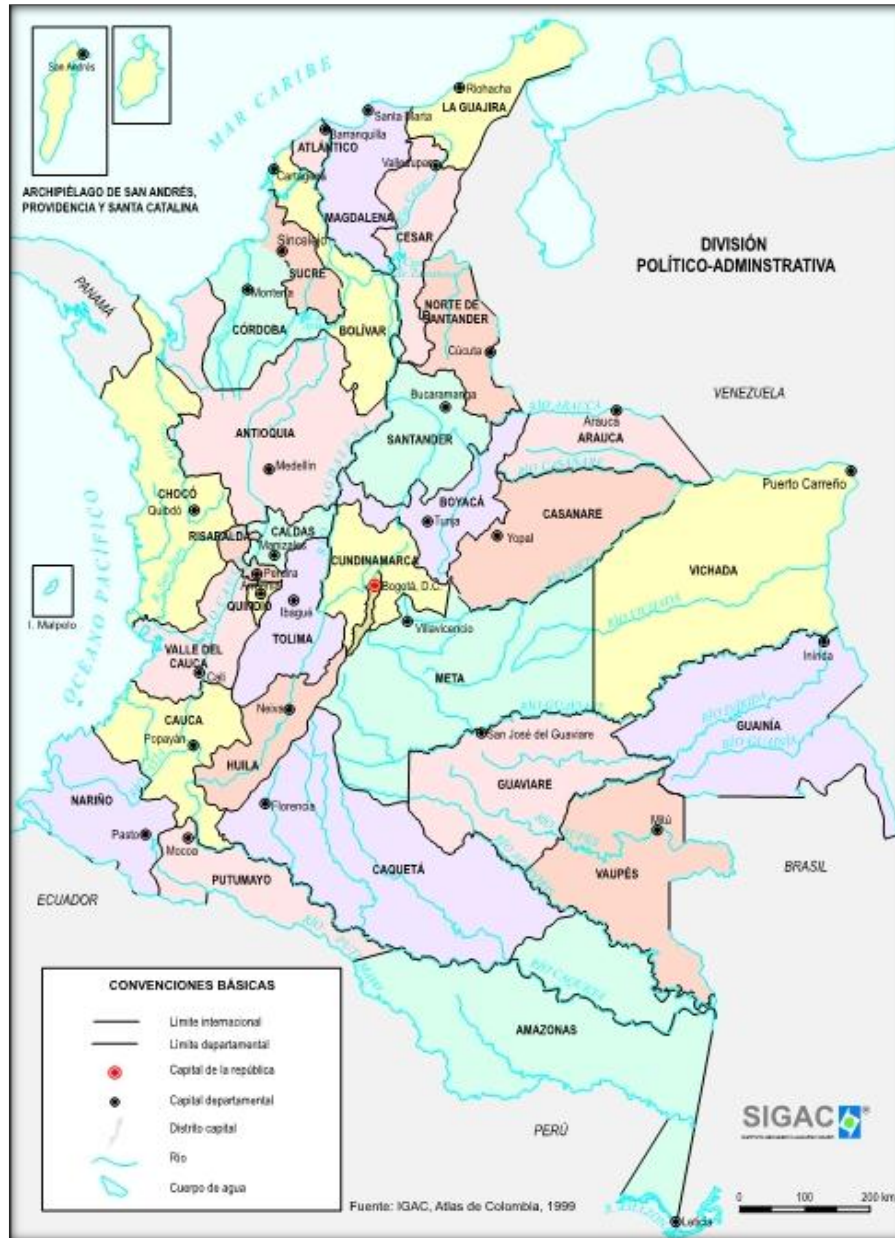
Figure 1 Carte de la Colombie