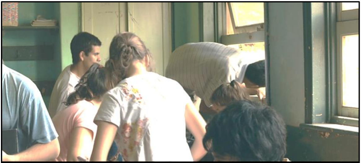
Fotograma no. 4: Plano en conjunto de los estudiantes, saliendo por la ventana, tomado desde la perspectiva de Paulina.

jerarquías. Para Freire, “nadie educa a nadie; (...) los hombres se educan entre sí, mediatizados por el mundo” ( Sobre la acción 26). Su propuesta es clara, la educación problematizadora necesita superar “la contradicción educador-educandos. Sin esta no es posible la relación dialógica” ( Pedagogía 89) Volviendo entonces al discurso de Paulina, “si vos querés que yo me vaya, me voy. Si vos querés irte, te vas” (00:15:25). En consecuencia, la mayoría de los estudiantes deciden dejar aula y la clase debe suspenderse. Algunos de los estudiantes, entre ellos uno de los integrantes de la patota, salen por la ventana como si se tratase de una salida improvisada ante una emergencia (Fotograma no. 4).