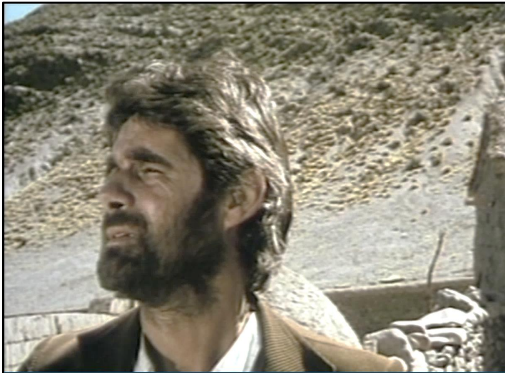
Fotograma no. 15: Primer plano del Maestro, contemplando el paisaje de Chorcán.

del hundimiento al buque, el maestro escucha la voz de su alumno, niño, preguntándole “¿y cómo es el mar?” 48 Desconsolado, sale entonces a contemplar el paisaje local (Fotograma no. 15: Primer plano del Maestro) por donde viene llegando Juanita, ahora embarazada de Verónico (Fotograma no. 16: Gran plano general de Juanita).