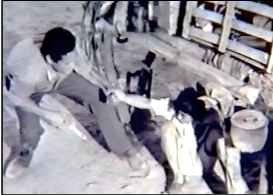
Fotograma no. 3: Plano conjunto del primer encuentro entre el maestro y Shunko.

Hay una ruptura en la secuencia cronológica en forma de analepsia o flashback . Dicha discontinuidad se produce cuando Reina (Fotograma no. 4: Primer plano de Reina), la pequeña amiga de Shunko, recuerda a Ana Vieyra (Fotograma no. 5: Primer plano de Ana Vieyra) y su accidente. Si tomamos en cuenta el tipo de plano y su profundidad, podemos ver que Murúa crea un paralelo, lo que da un aspecto de continuidad entre el destino de ambas, Reina y Ana.