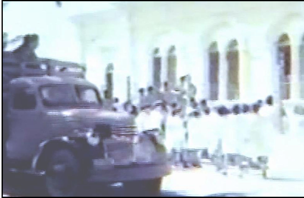
Fotograma no. 15: Plano general de la fachada de la escuela citadina, a donde llegan en camión.

El gran portón de esta escuela se abre al pasaje de todos los niños, que se pierden en una gran masa homogénea, pues llevan todos guardapolvos blancos. Curiosamente, los escasos guardapolvos que han sido donados al grupo periférico de Shunko son oscuros (Fotograma no. 16: Gran plano general del acto), como los de los operarios de fábricas, servicio de mantenimiento y limpieza; y no blancos, como los de los estudiantes citadinos, los médicos y los científicos.