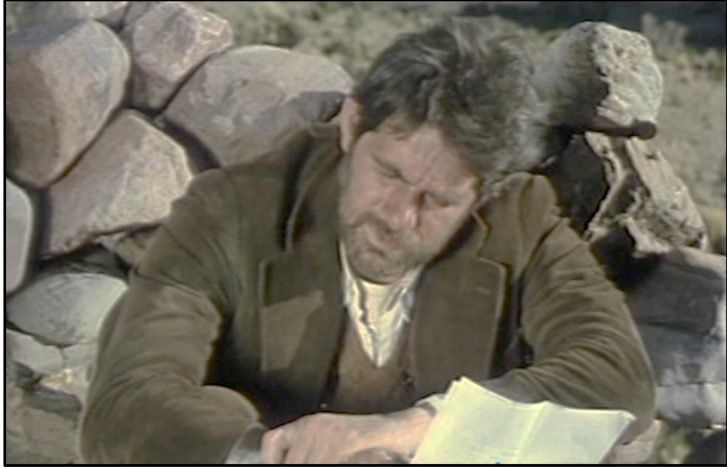
Fotograma no. 9: Plano medio del maestro, en el paisaje, leyendo la carta.