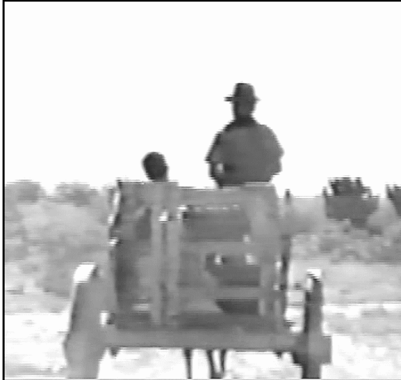
Fotograma no. 18: Plano conjunto de la partida del maestro.

Las relaciones de interculturalidad en la matriz educativo-institucional argentina, que se activan en la praxis docente; y sus efectos en las dos dinámicas en contrapunto, que caracterizan el filme de Murúa, revelan la imposibilidad de la implementación escolar de una identidad nacional de carácter monológico. Aun cuando este aspecto comienza a resquebrajarse con los contra-discursos de los años 60, no llega a fracturarse. Volveremos sobre este tema en el capítulo siguiente, basado en el filme de Miguel Pereira, La deuda interna .