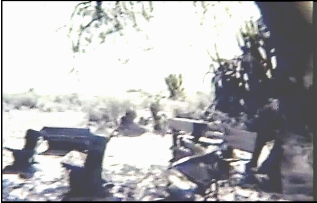
Fotograma no. 2: Plano descriptivo de la supuesta escuela rural.

Al llegar, queda sorprendido de la ausencia de una construcción que albergue la escuela; esta consta apenas de un grupo de pupitres a la sombra de un gran árbol de algarrobo (Fotograma no. 2: Plano descriptivo de la escuela).