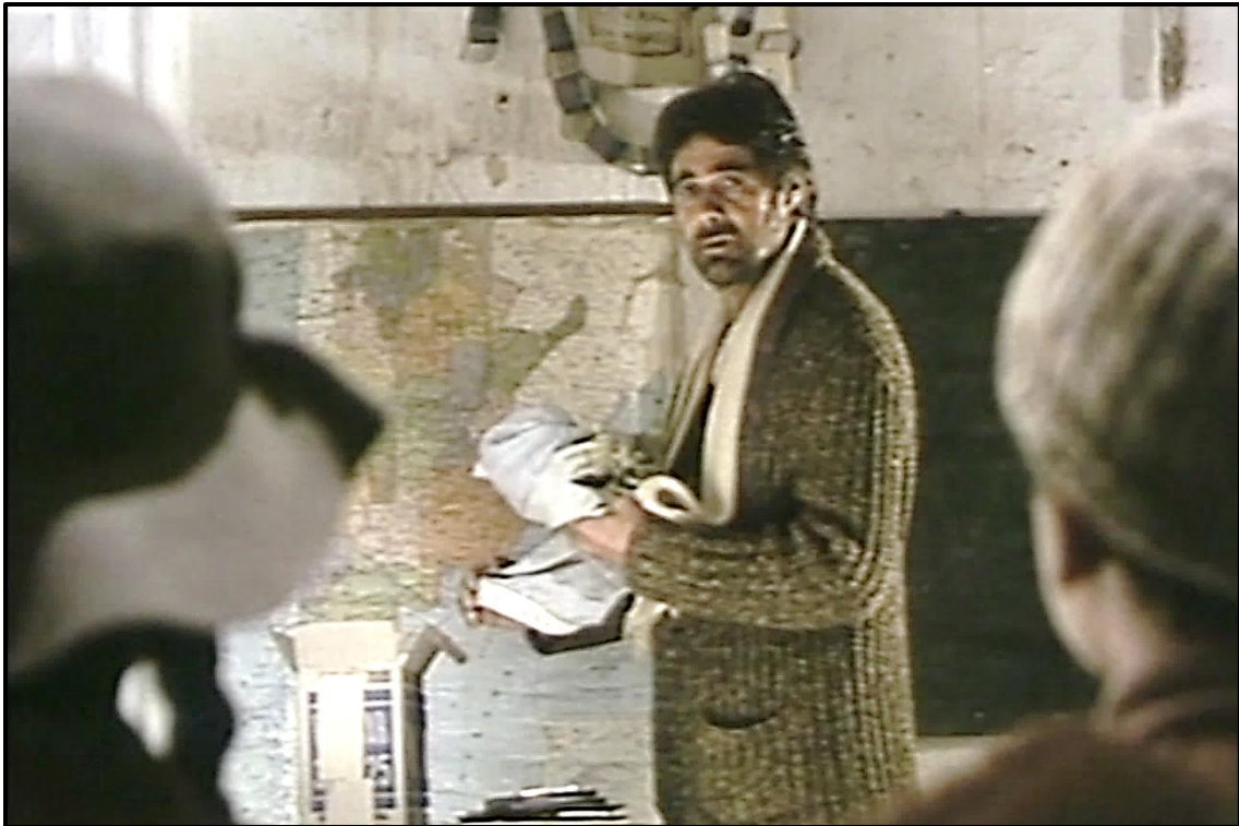
Fotograma no. 10: Plano americano del maestro, sosteniendo la bandera argentina, desde la perspectiva de Juanita y Verónico.

excluido, en términos dusseleanos, que interrumpe la escena. 46 Se produce un largo silencio subrayando el gesto enmudecido del maestro que en estado de concientización se queda inmóvil con la bandera en las manos. El plano (americano) habla por sí mismo, colocando “convenientemente” al maestro de pie delante del mapa de la República Argentina, sosteniendo la bandera nacional y tomado desde la perspectiva de Verónico y Juanita (Fotograma no. 10).