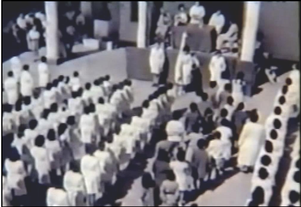
Fotograma no. 16: Gran plano general, picado, del acto de conmemoración en donde se contrastan los guardapolvos blancos (citadinos) y grises (rurales).

Es así como, desde el plano estético-discursivo, se rompe explícitamente con la homogeneidad y se inscribe implícitamente la marginalización sufrida por los rurales. Durante el acto, una de las docentes ciudadinas ofrece el discurso conmemorativo en un lenguaje sostenido y poco accesible a los alumnos, “Que el espíritu de lucha del rebelde y admirable sanjuanino que se llamó Domingo Faustino Sarmiento sea nuestra bandera. Sarmiento, maestro de maestros nos señala el camino del deber y del sacrificio...” (00:57:38). Luego de tal discurso, una maestra pide a los discentes (aburridos) que aplaudan y así lo hacen con una actitud desinteresada (00:57:53). A la salida, Shunko osa echarle la lengua al busto sarmientino, como gesto contra-discursivo (Fotograma no. 17: Busto de Sarmiento y Shunko).