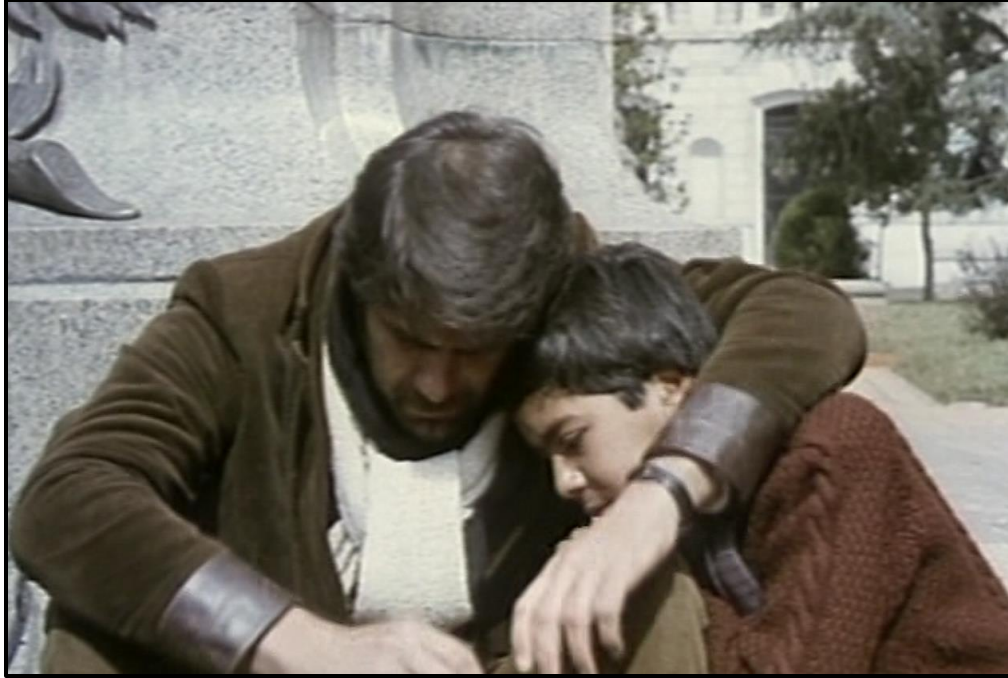
Fotograma no. 8: Plano medio del maestro y Verónico en la base del monumento.

En lo que respecta a la reflexión sobre la discursividad centrípeta de la educación tradicional, es interesante la manera en que Pereira revisa la narrativa oficial sobre los sitios de memoria, a los cuales reinterpreta. Como señala Pierre Nora en Les Lieux de Mémoire , el pasado implica un proceso de instrumentalización en el presente, ya que su evocación suele tener una finalidad política dentro de un marco social. El general Manuel Belgrano resulta ser la única figura heroica enseñada en la escuela como el emblemático creador de la bandera y su monumento se yergue en la plaza Belgrano (en la capital de la provincia del departamento Dr. Manuel Belgrano), en donde el maestro es violentamente indagado por la policía. Pereira, como Nora, hace hincapié en la ambigüedad relacionada con los sitios de la memoria. 37 En este sentido, la película de Pereira