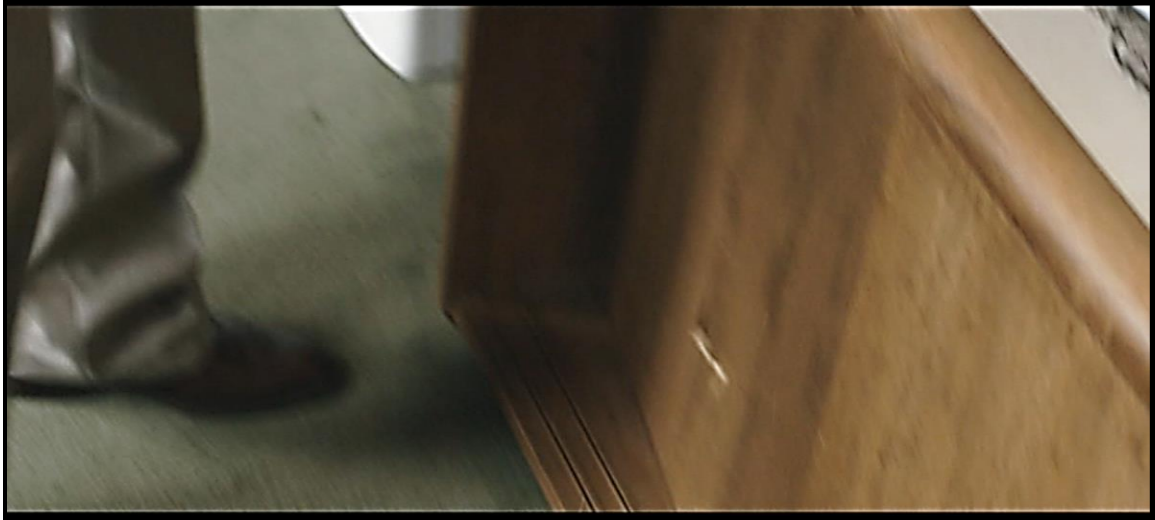
Fotograma no. 15: Primer plano de la ruptura de la pared del tribunal por la patada de Fernando.

Cansada de la tensa y larga discusión, finalmente, Paulina toma la palabra (en sentido bajtiniano) e interrumpe el monólogo de la justicia. La abogada y docente le dice a su padre juez: “Lo que a mí me pasó no lo puede entender nadie” (01: 32:45); “soy la consecuencia de un mundo horrible que no genera otra cosa más que violencia” (01:33:12). El juez le pide que deje de hablar; él no se siente bien. Paulina continúa: “Este hijo es el resultado de una realidad que vos no podés entender. Yo tampoco, pero (...) tengo una certeza, (...) está adentro mío, quiero que nazca”; y aclara que ya no importan ellos, que “ya es otra cosa (...)”. Dice, ya estoy acá, (...). No me puedo ir, no me quiero ir (...), quiero seguir” (1:33:31-01:34:03).