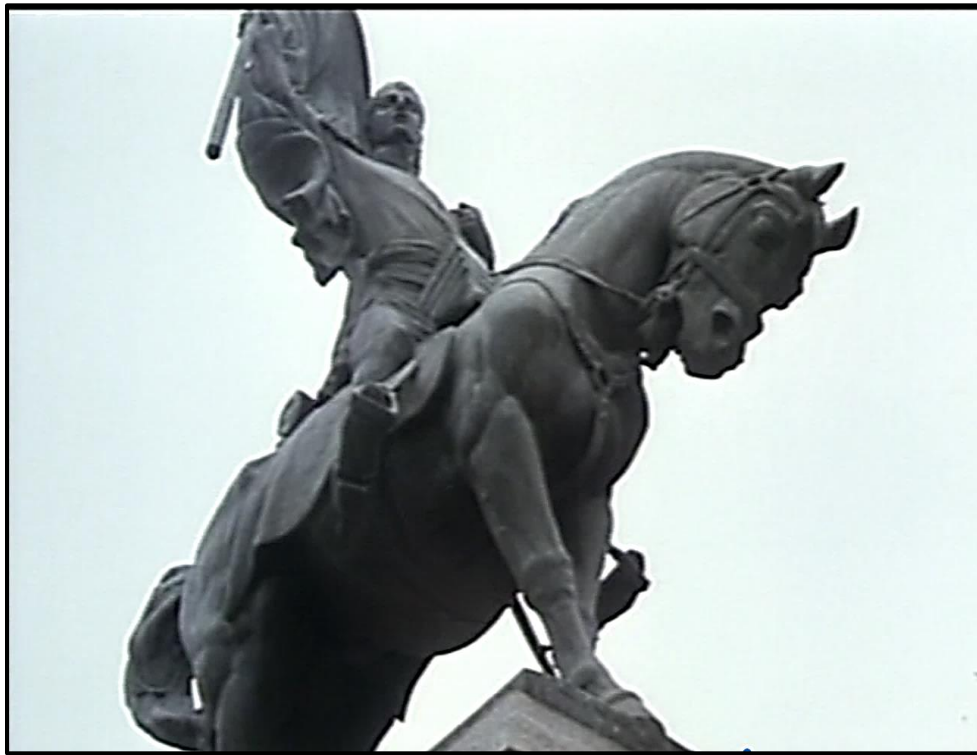
Fotograma no. 5: Plano contrapicado extremo del Monumento al General Belgrano.

alumno mirando el monumento (Fotograma no. 5: Plano contrapicado extremo del monumento); de esta manera, se evoca también la última imagen del padre desaparecido (en donde “aparece” inmortalizado junto al monumento). El maestro vuelve sobre su discurso patriótico. Le explica a Verónico, “este es el monumento al General Belgrano y atrás (...) esa es la Casa de Gobierno en donde está depositada la bandera que creó el General Belgrano, se llama Salón de la bandera y allá (...) esa es la Catedral en donde la bendijo por primera vez” (01: 06: 21). Luego, el maestro le dice que va al destacamento de policía y que se reencuentran ahí. Verónico va a visitar estos sitios de la memoria (oficial/escolar), mientras el (ingenuo) maestro va a la comisaría a preguntar por la desaparición de Cástulo.