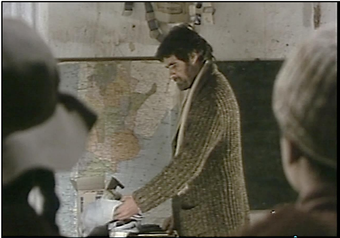
Fotograma no. 11: Plano americano del Maestro, depositando la bandera en su escritorio, incluyendo la perspectiva de Juanita y Verónico.

freiriana, dado que rompe con la idea de la jerarquización tradicional, la de maestro sapiente y estudiante ignorante. Esta actitud dialógica, generada en la horizontalidad discursiva, invierte los roles educador y educando, poniendo al maestro en situación de aprendizaje crítico con lo cual se concientiza. “Emblematizado” con la bandera nacional en las manos, no le queda más que depositarla silenciosamente en su ( vacío ) escritorio (Fotograma no. 11: Plano americano del maestro). Verónico, observándolo, subraya la escena con su pregunta, “¿no la va a izar, maestro?” (01:15:15).