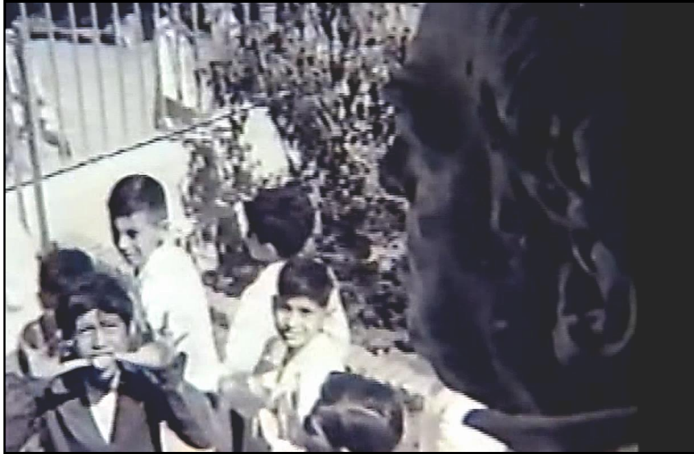
Fotograma no. 17: Plano conjunto del busto de Sarmiento en donde Shunko, en picado, le echa la lengua.

Esto da lugar a una pelea, un incidente que separa nuevamente a los ciudadanos de los periféricos. En cuanto a Shunko, como sujeto reclutado por el sistema educativo nacional y obligatorio, acepta el discurso docente, pero lo acomoda a su experiencia como minoría etno-cultural en una nacional homogeneizadora. En este sentido, volvemos a la idea del sujeto des-identificado que osa pensar (Pêcheux). Shunko ha logrado alcanzar los objetivos impuestos por el maestro, o sea aprender la lectoescritura y ciertos valores patrióticos. Sin embargo, guarda una actitud activa y resguarda su esquema de conocimientos previos (Ausubel), al cual agrega la cultura nacional, que le es ajena y que se le presenta como monolítica, homogénea. No obstante, al mismo tiempo, ha logrado transformar el discurso (hegemónico) de su maestro.