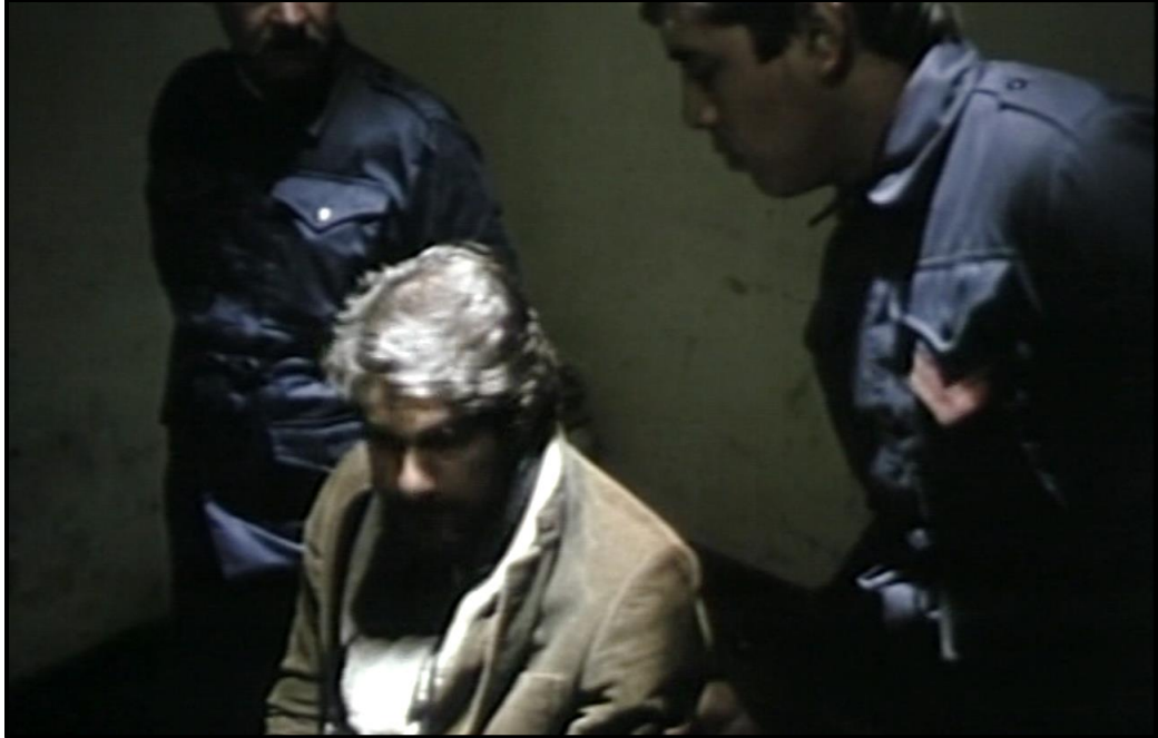
Fotograma no. 7: Plano medio, en picado, del maestro en la comisaria.

Terminado el interrogatorio y revisitados los símbolos que propaga la escuela, los dos protagonistas se reencuentran en la base del heroico monumento al General Belgrano: héroe de la independencia; con lo cual este sitio de la memoria queda también reinterpretado en el marco de la dictadura de ultraderecha. Cuando Verónico se acerca y le cuenta sobre las maravillas de la Sala de la Bandera, el maestro completamente abrumado por las circunstancias llora en silencio. El maestro trata, pero no consigue, proteger al niño, hecho que se traduce la última imagen de la escena. Con un plano medio, descriptivo, Pereira muestra al adulto abrazando al niño en la base del monumento al General Belgrano como testigo (Fotograma no. 8).