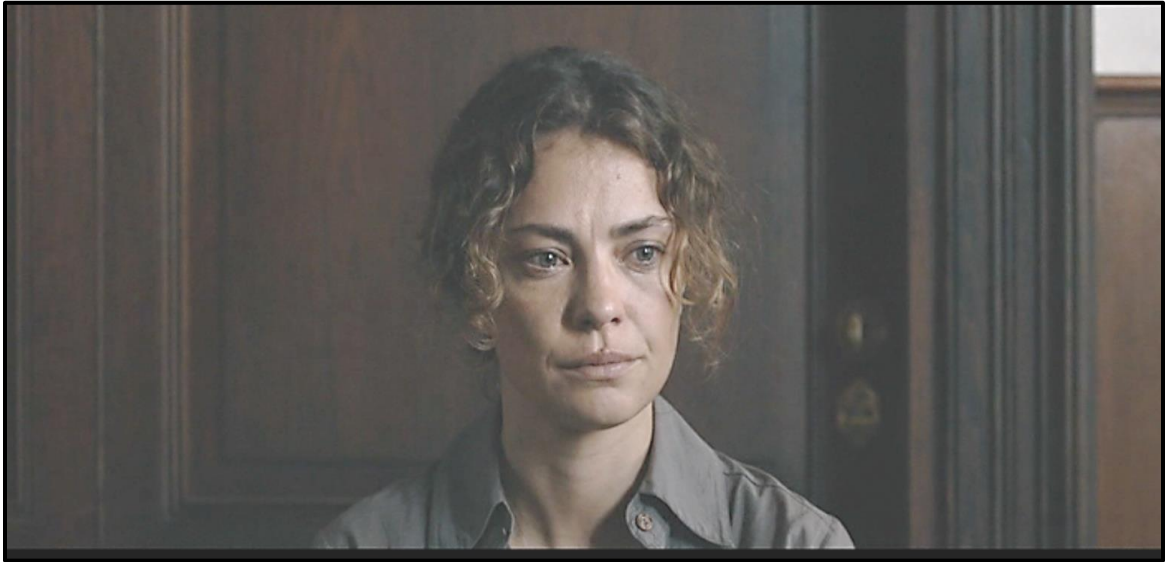
Fotograma no. 16: Primer plano de Paulina conmovida, ofreciendo su juramento.

las condiciones extremas en las que se encuentra atrapada, sabemos que está decidida a ofrecer un testimonio falso. Se vuelve a inscribir entonces la idea “de papelitos” en términos de la legislación y su (in)operatividad.