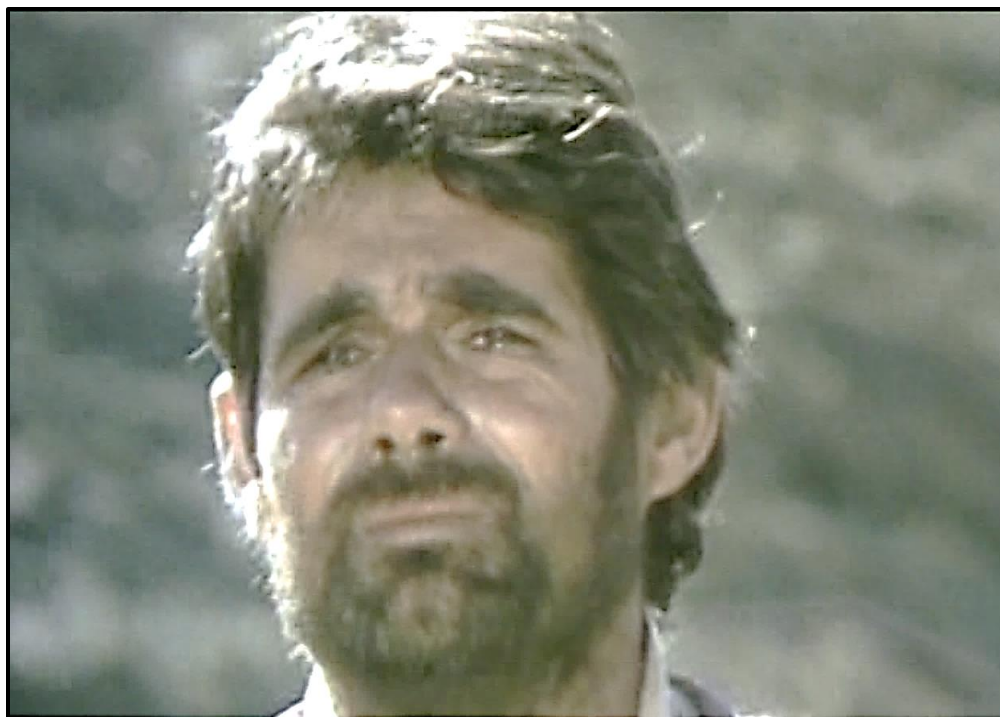
Fotograma no. 13: Primerísimo primer plano del maestro, llorando, en su partida.

Hay una elipsis de algunos años; y, a nivel paratextual, se indica Humahuaca 1982, año de la Guerra de Malvinas. Pereira incorpora material de la época, por ejemplo, el discurso oficial de Galtieri y recortes de imágenes del fervor nacional. Se confirma así la tesis de Anderson, según la cual la comunidad imaginada se alimenta sobre la idea de fraternidad entre los compatriotas (desconocidos), llegando paradójicamente a provocar “que millones de personas maten y, sobre todo, estén dispuestas a morir por imaginaciones tan limitadas” (25). El maestro no se identifica con la propaganda militar sobre la guerra. Se encuentra preocupado por la falta de cartas o noticias de Verónico. Mientras tanto, la trama va desplegando imágenes de la guerra, incluyendo el hundimiento al ARA-General Belgrano, fuera del área de exclusión.