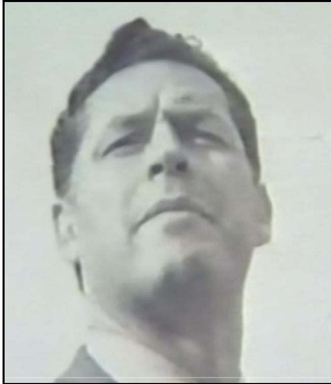
Fotograma no. 10: Primerísimo primer plano del maestro de pie, en contrapicado, cuando llega Shunko.

Al contrario, cuando el maestro mira a los niños que van llegando se utiliza el picado (Fotograma no. 11: Plano picado del maestro y un nuevo educando).