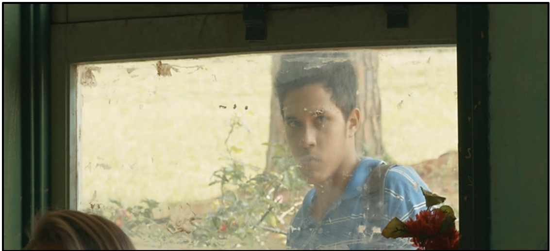
Fotograma no. 5: Plano corto de un estudiante, miembro de la patota, mirando desde afuera de la clase a Paulina (fuera de campo).

—que había intervenido la clase anterior e incentivado la salida de la mayoría— resulta evidente: “yo, lo primero que haría, trataría de salir”; a lo que la docente replica: “No, no podés salir”. En estos momentos uno de los estudiantes de la patota mira la situación desde afuera por la ventana (Fotograma no. 5). Aquí podemos inferir que Mitre deja entender que escolarizado o no, ya está fuera del sistema o bien podría estar indicando una salida.