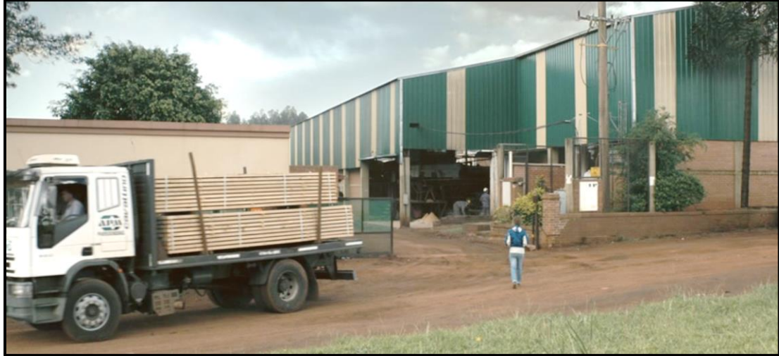
Fotograma no. 13: Plano general de Paulina en el aserradero.

En su encuentro, Ciro y Paulina quedan enfrentados (plano-contraplano) y la perspectiva subraya la subjetividad de Paulina (Fotograma no. 14. Plano medio corto de Ciro, desde la perspectiva de Paulina). Dice Paulina: “Ciro, necesito hablar con vos” (01:10:48). Ciro no busca redimirse, al contrario, la frena con un “¿qué querés?” (01:10:56). Muy a pesar de su rostro cansado, Paulina es quien trata de tranquilizarlo para establecer la comunicación: “No te preocupes, no te va a pasar nada. Nadie sabe que vine acá” (01:10:56). Ciro, insiste con tono amenazante, que señala su actitud defensiva: “¿Qué es lo que querés?” (01:11:02); Paulina, vuelve a repetirlo, “Ya te dije, necesito hablar (...), no te asustes, te doy mi palabra, no te va a pasar nada” (01:11:15).