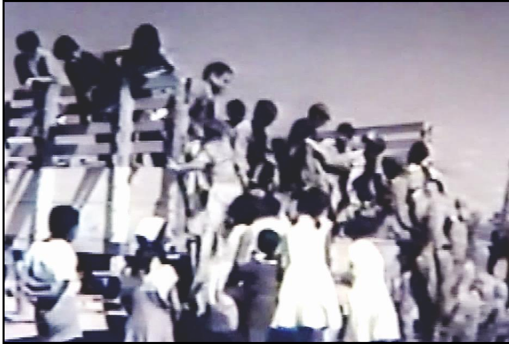
Fotograma no. 14: Plano conjunto del camión y del grupo en su visita a la escuela de la ciudad por la conmemoración sarmientina.

La escuela de la ciudad es de solida construcción y contrasta extremadamente con la nueva escolita rural, que la comunidad local ha construido con esfuerzo en la parcela donada por don Cipriano (Fotograma no. 15. Plano contextual de la escuela citadina).