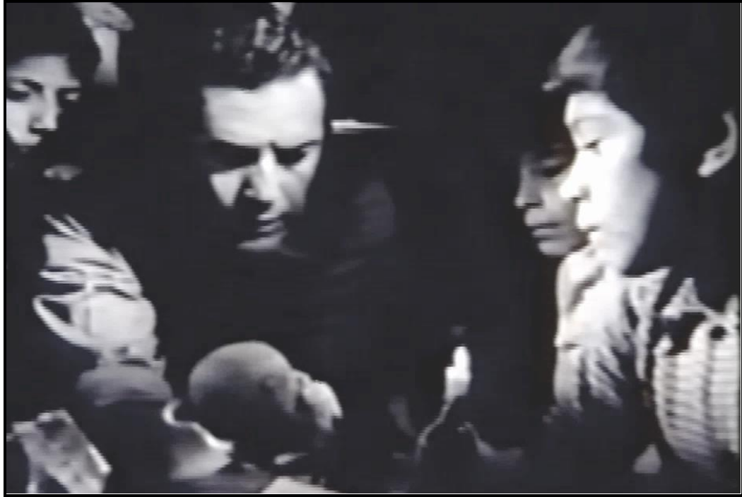
Fotograma no. 8: Plano medio de la modelización científica del eclipse lunar que improvisa el maestro para la clase.

Frente a esa demostración racional del educador, Shunko toma la voz, por un lado, de los nuevos discursos de posición contrahegemónica y por el otro, de la cultura quichuo-santiagueña. Retruca, “aquí sabemos de otra manera, señor” (00:32:54). Ellos saben otra historia y así explica el mito a su maestro: se trata del “funeral de la luna”. Entonces, por la intervención de Shunko y Reina a propósito de doña Jashi/Jaira (la chamana) que “sabe todo”, van a visitarla para poder comprender el fenómeno. Esto alude claramente a la perspectiva freiriana, que señala cómo “los sujetos cognoscentes buscan, dialógicamente, conocer el objeto cognoscible” (ibid. 43). En la escena, con un plano contextual, vemos al grupo sentado de manera circular junto a la chamana, Jashi/Jaira. Ella le explica al docente y a los niños, quienes escuchan atentos, el fenómeno desde