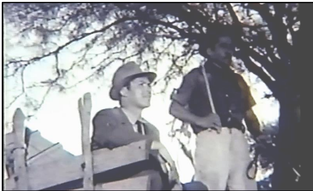
Fotograma no. 1: Plano medio del maestro (junto al conductor de la carreta), vestido de citadino, observando el panorama local con asombro.

maestro en Conmemoración a Sarmiento), el accidente de Shunko y muerte de Reina, y la construcción comunitaria de la escuelita en terrenos donados por un vecino; desenlace: una vez ha dejado en claro que la narrativa fundacional debe primar sobre la “oficial” del currículo, se da lugar a su partida, justificada por obligaciones en la ciudad, en donde lo espera su madre. Inicialmente, el joven maestro viene llegando por un camino sinuoso, se muestra una cruz sobre una tumba, que marca el tono dramático. Ese tono se acentúa con la música distorsionada, compuesta por sonidos estridentes y bajos de tambores y campanas, la cual se mezcla con una repetición sonora que se asemeja a una marcha fúnebre, resonando como un lamento continuo que acompaña la llegada del forastero. El maestro tiene aspecto citadino, lleva traje y corbata y contempla el paisaje con gesto asombrado (Fotograma no. 1: Plano medio del maestro en la carreta).