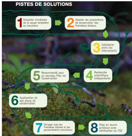
Figure 2 Pistes de solution proposées dans le rapport Alerte boréale

Cette stratégie, visant d'une part à rebâtir son identité en tant que mouvement de résistance en confrontant directement l'industrie et en soulignant l'importance de protéger les populations locales, et de l'autre, à réaffirmer son rôle dominant en démontrant sa maîtrise de l'enjeu dans la forêt boréale (notamment par l'utilisation de chiffres et données scientifiques), a été d'autant plus apparente dans un rapport publié seulement quelques mois plus tard. Celui-ci a eu des répercussions majeures sur la suite de la campagne de Greenpeace.