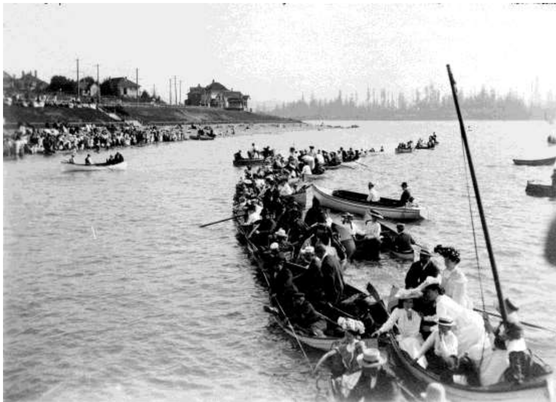
Figure 2.3. Boats in English Bay observing a swimming race. (1905). AM54-S4- Be P12.01. Timms P.T. fonds. City of Vancouver Archives, Vancouver, B.C.