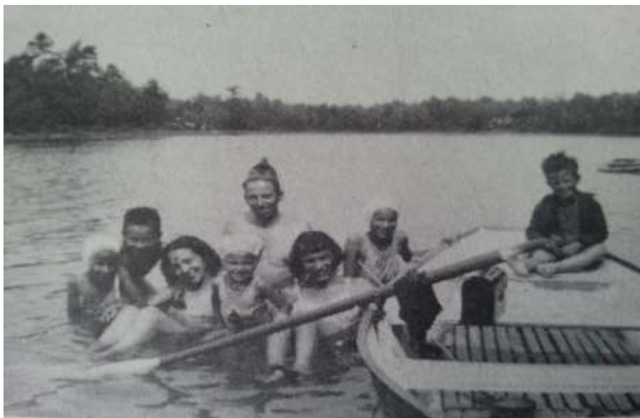
Figure 2.12. Famille Talbot. (n.d.) Talbot, Growing up Black in Canada (p. 27)