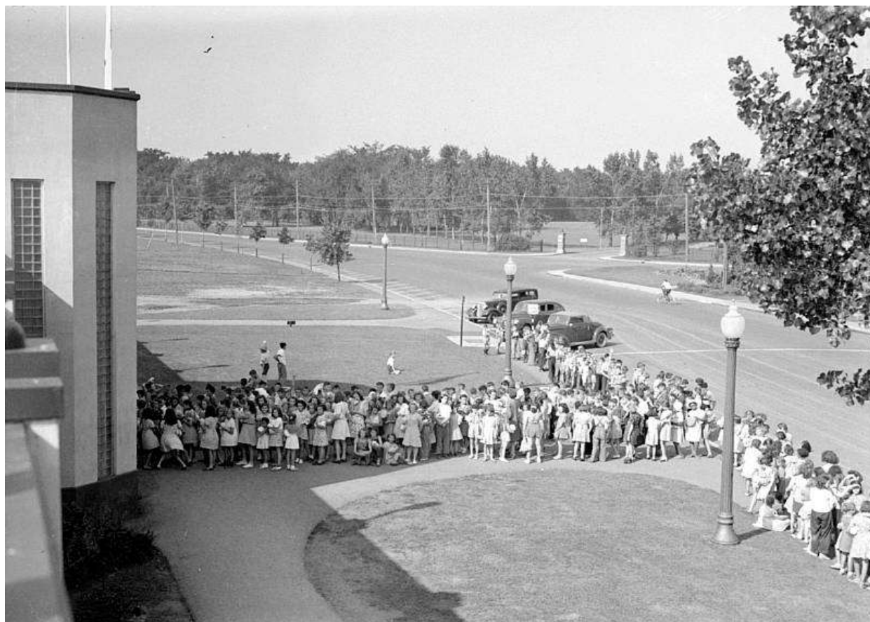
Figure 2.8. Swimming. Verdun Pool. (27 juillet 1943). P48,S1,P9669.