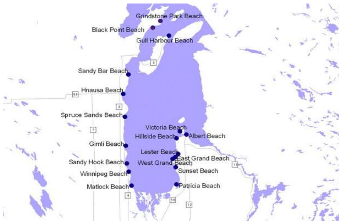
Figure 2.14 Lake Winnipeg. (n.d.). En ligne http://www.gov.mb.ca/waterstewardship/quality/lake_winnipeg.html