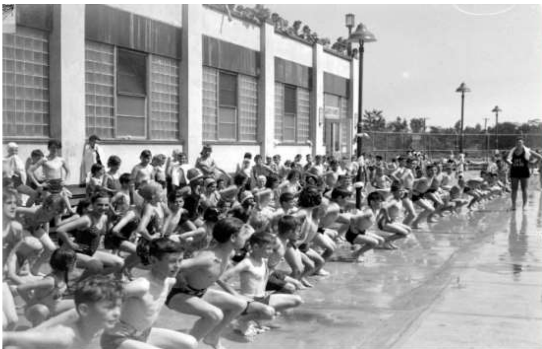
Figure 2.7. Swimming. Exercising. (23 juin 1943). P48,S1,P9649. Fonds Conrad Poirier. Collection numérique de Bibliothèque et Archives nationales du Québec. Collection Pistard. Centre : Montréal.