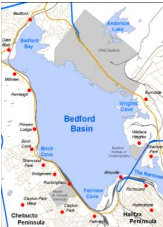
Figure 2.2a. Carte du Bassin Bedford montrant l'emplacement d'Africville. (n.d). < http://storiesoffthetrack.wordpress.com/tag/africville/ >