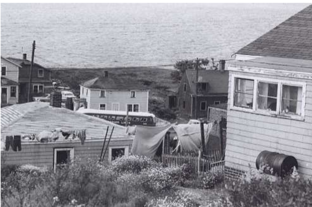
Figure 2.2 b. Distant view of Acadian Lines bus passing through Africville. (ca. 1965). NSARM accession no. 1989-468 vol. 16 / negative sheet 5 image 18. Brooks B. fonds. Nova Scotia Archives, Halifax, N.S.