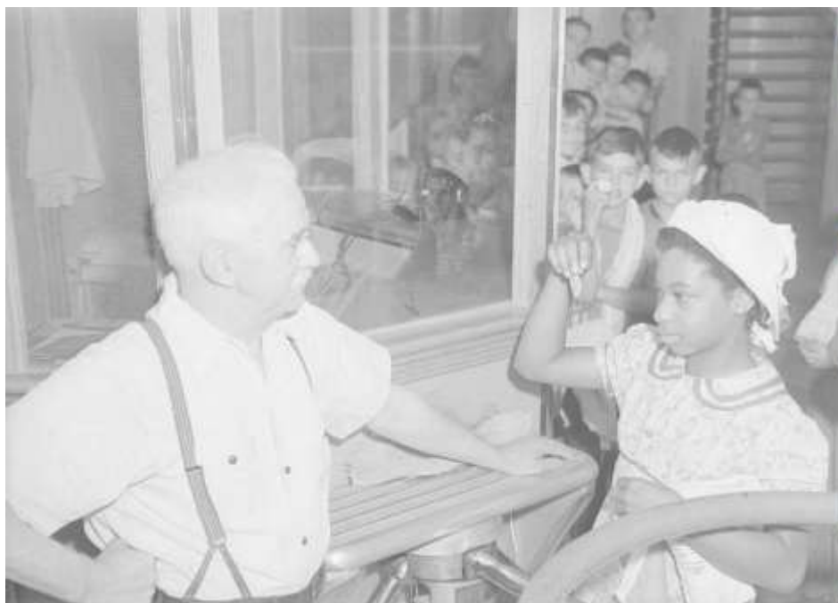
Figure 2.6. Swimming. Verdun Pool. (27 juillet 1943). P48,S1,P9666. Fonds Conrad Poirier. Collection numérique de Bibliothèque et Archives nationales du Québec. Collection Pistard. Centre : Montréal.