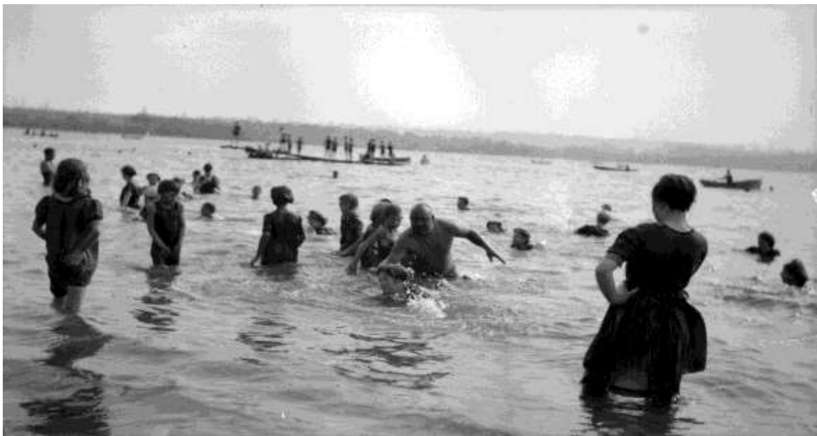
Figure 2.5. Joe Fortes [teaching swimming] at English Bay. (1912).