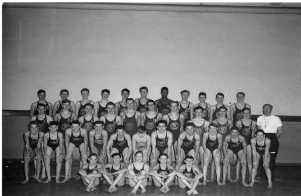
Figure 2.10. Group. Mt High School (27 janvier 1947). P48,S1,P15396.