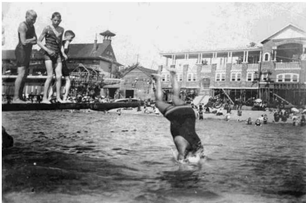
Figure 2.4a. Joe Fortes diving into water at English Bay. (ca.1906). AM336-S3-3-CVA 677-591.