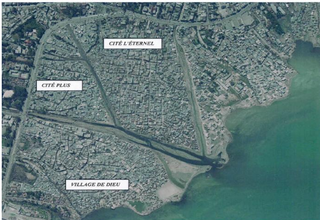
Figure 3: Vue aérienne des quartiers Cité de l'Éternel, Village de Dieu et Cité Plus