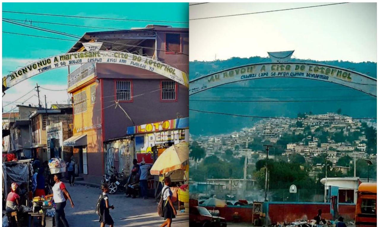
Figure 4: Entrée principale de Cité de l'Éternel

L'espace où se situe la Cité est une terre marécageuse, jadis occupée par une forêt de mangroves. Cette dernière, après la chute du dictateur Jean-Claude Duvalier (1986), fut rasée et de nombreux habitants ont remblayé les parties marécageuses afin de construire leurs habitations. Elle fut nommée Cité de l'Éternel par ses premiers habitants, qui étaient des militaires et des anciens membres des VSN (Henrys et al., 2018; Jean-Bouchard, 2009; Louis, 2009). Au fil des ans, la Cité est devenue un espace de plus d'une vingtaine d'hectares de terre, soit plus de 0,2 km 2 . Le quartier s'est accru spatialement, par remblayage des terrains marécageux, et démographiquement, par croissance naturelle et flux migratoire.