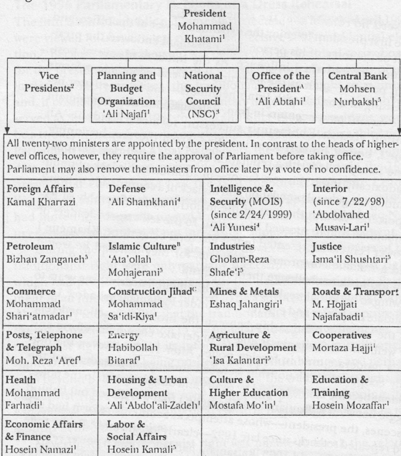
Diagram 4: The Executive under Mohammad Khatami