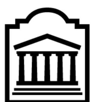
Image # 3 : « JuriGlobe : Groupe de recherche sur les systèmes juridiques dans le monde », Site web officiel de l'Université d'Ottawa (Archives web) : http://archive.is/BuDof .

Image # 2 : http://dynamicz34.deviantart.com/art/Black-and-Gold-Yin-Yang-412707166 .