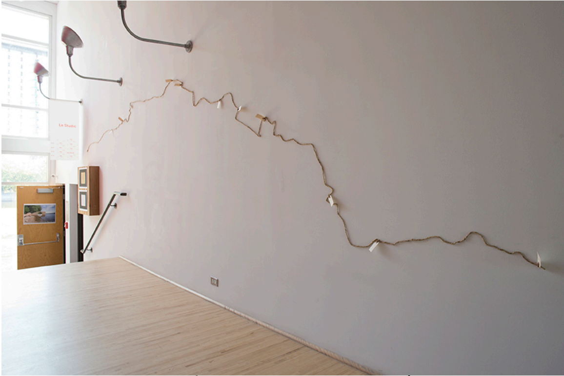
DE ROUTE ET DE RIVIÈRE, vue de l'installation, DAÏMÔN, Gatineau, 2016.