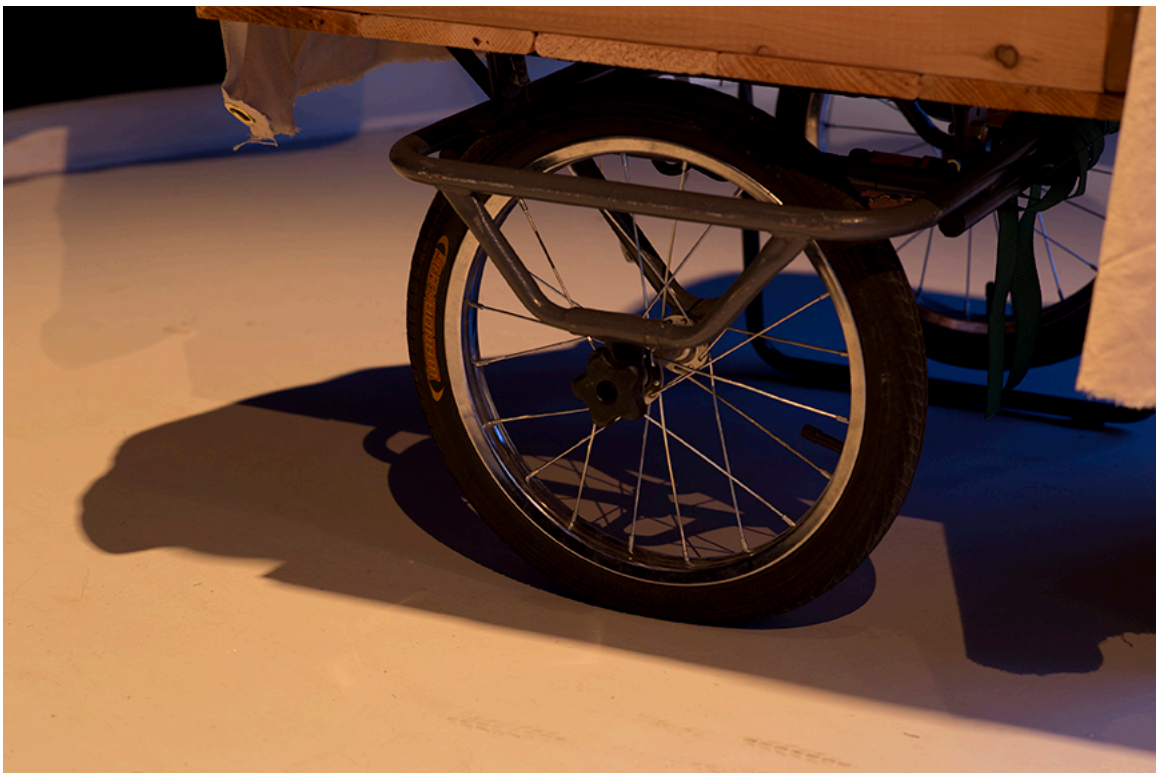
DE ROUTE ET DE RIVIÈRE, détail de l'installation, DAÏMÔN, Gatineau, 2016.