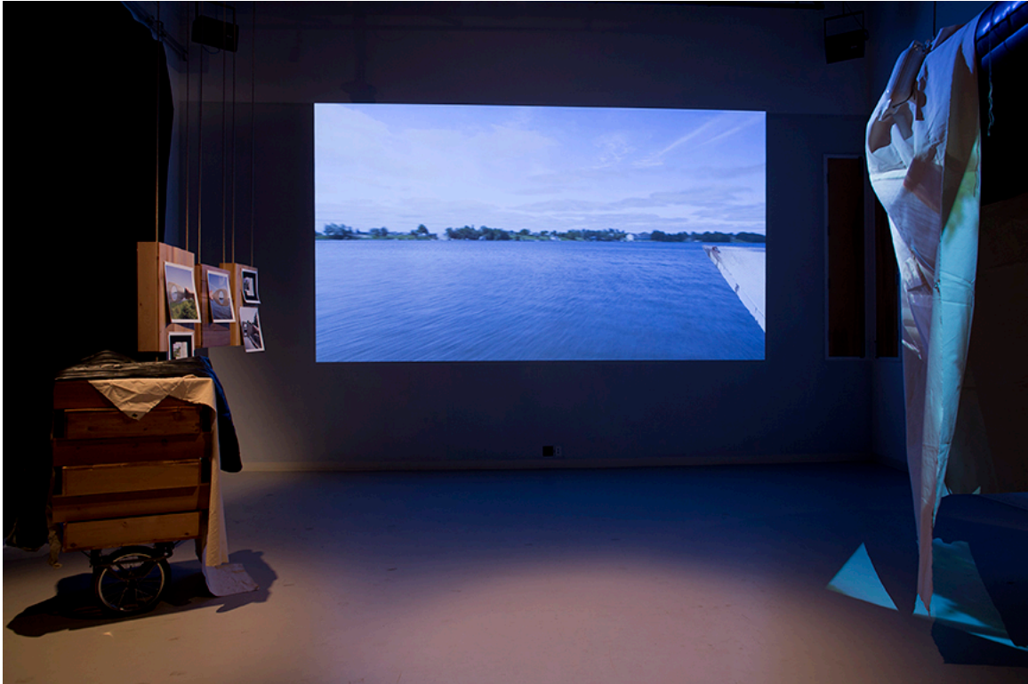
DE ROUTE ET DE RIVIÈRE, vue de l'exposition, DAÏMÔN, Gatineau, 2016.