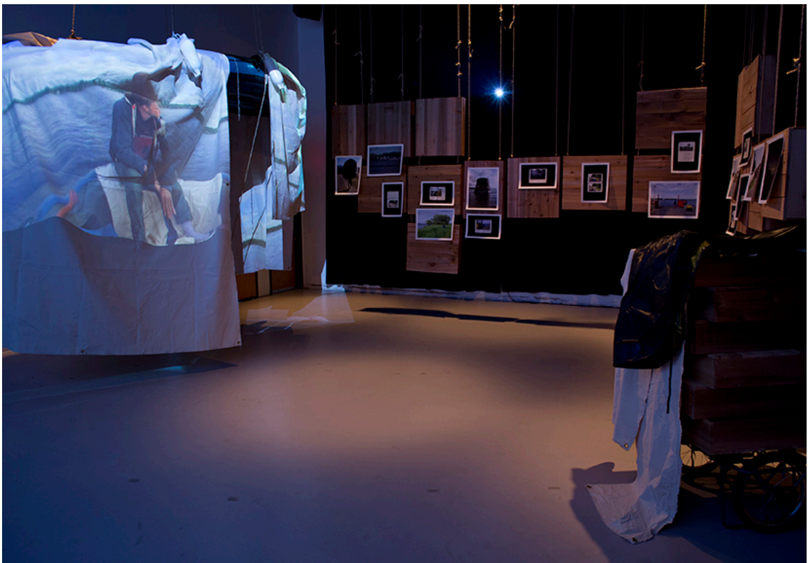
DE ROUTE ET DE RIVIÈRE, vue de l'exposition, DAÏMÔN, Gatineau, 2016.