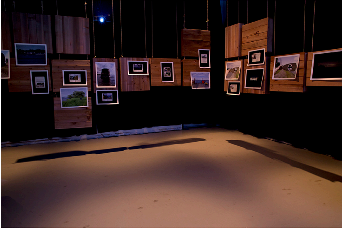
DE ROUTE ET DE RIVIÈRE, vue de l'exposition, DAÏMÔN, Gatineau, 2016.