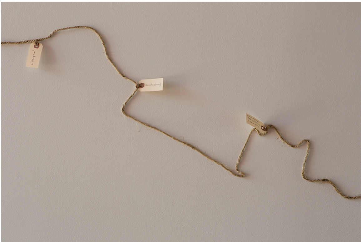
DE ROUTE ET DE RIVIÈRE, détail de l'installation, DAÏMÔN, Gatineau, 2016.