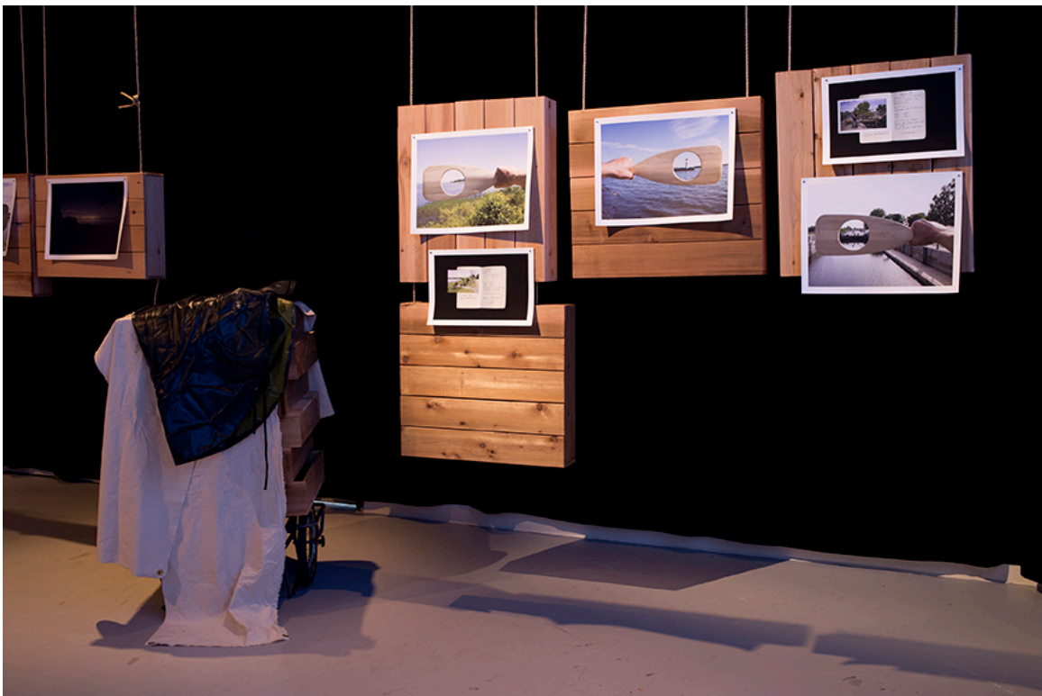
DE ROUTE ET DE RIVIÈRE, vue de l'installation, DAÏMÓN, Gatineau, 2016.