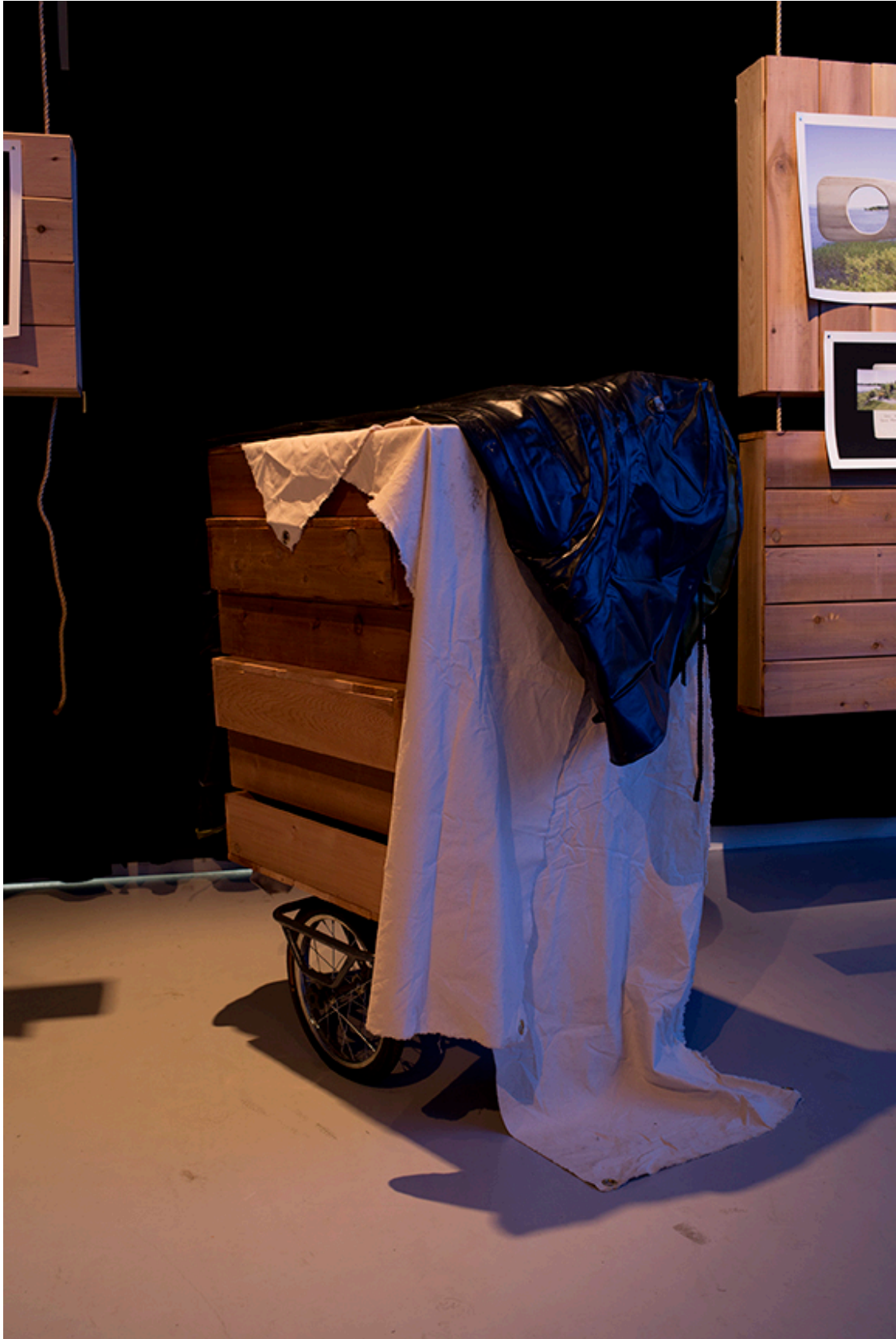
DE ROUTE ET DE RIVIÈRE, vue de l'installation, DAÏMÔN, Gatineau, 2016.