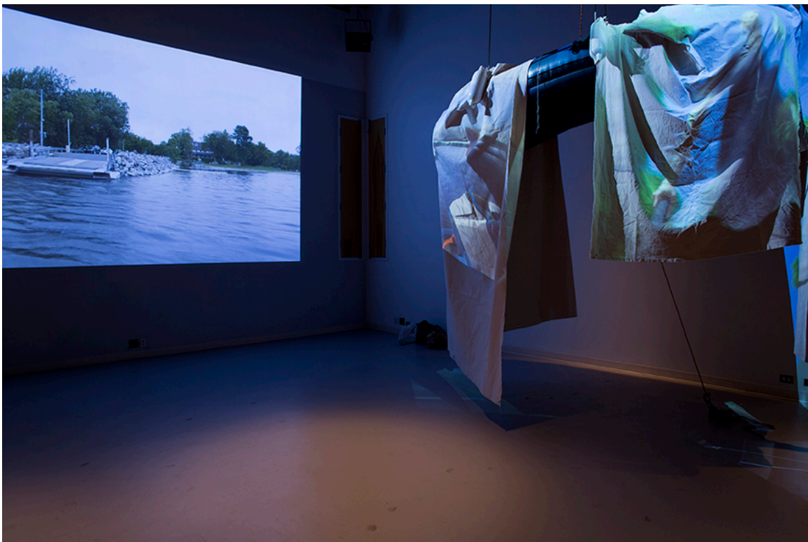
DE ROUTE ET DE RIVIÈRE, vue de l'exposition, DAÏMÔN, Gatineau, 2016.