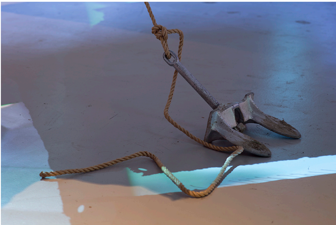
DE ROUTE ET DE RIVIÈRE, détail de l'installation, DAÏMÔN, Gatineau, 2016.