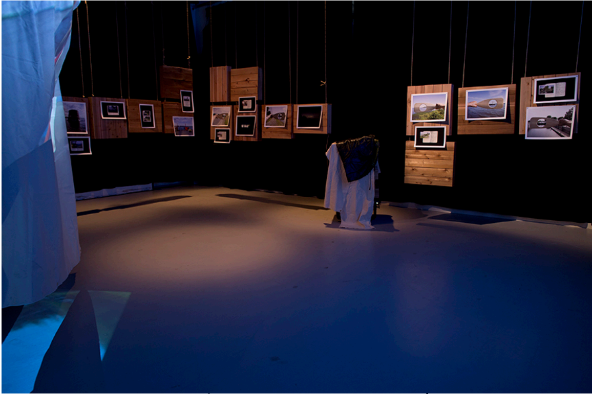
DE ROUTE ET DE RIVIÈRE, vue de l'exposition, DAÏMÓN, Gatineau, 2016.