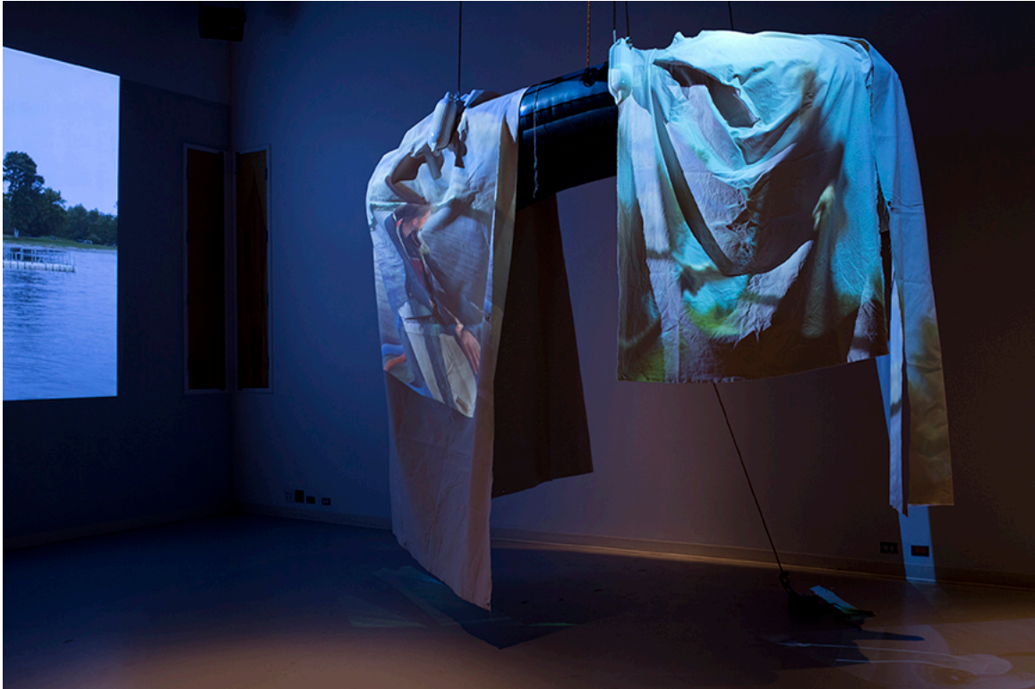
DE ROUTE ET DE RIVIÈRE, vue de l'installation, DAÏMÔN, Gatineau, 2016.