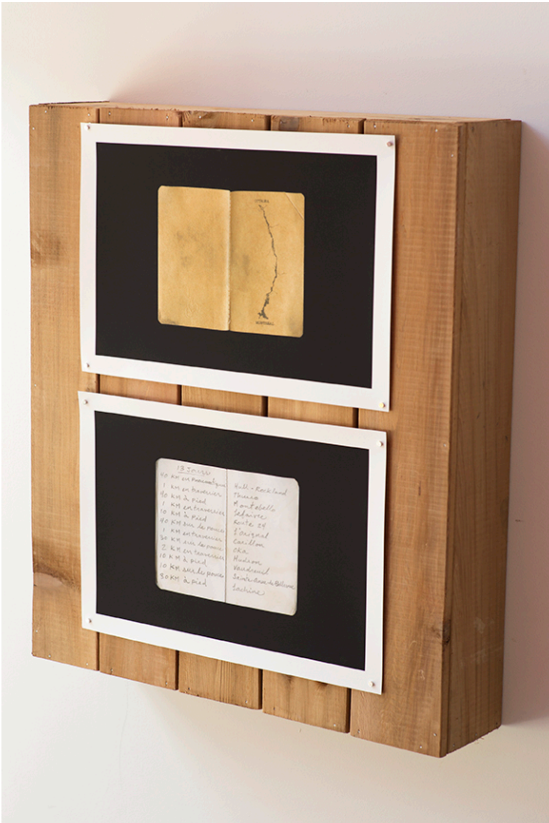
DE ROUTE ET DE RIVIÈRE, détail de l'installation, DAÏMÔN, Gatineau, 2016.