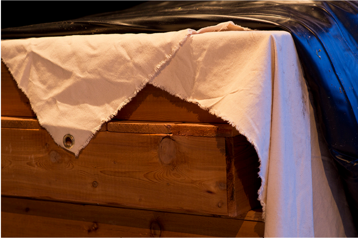
DE ROUTE ET DE RIVIÈRE, détail de l'installation, DAÏMÔN, Gatineau, 2016.