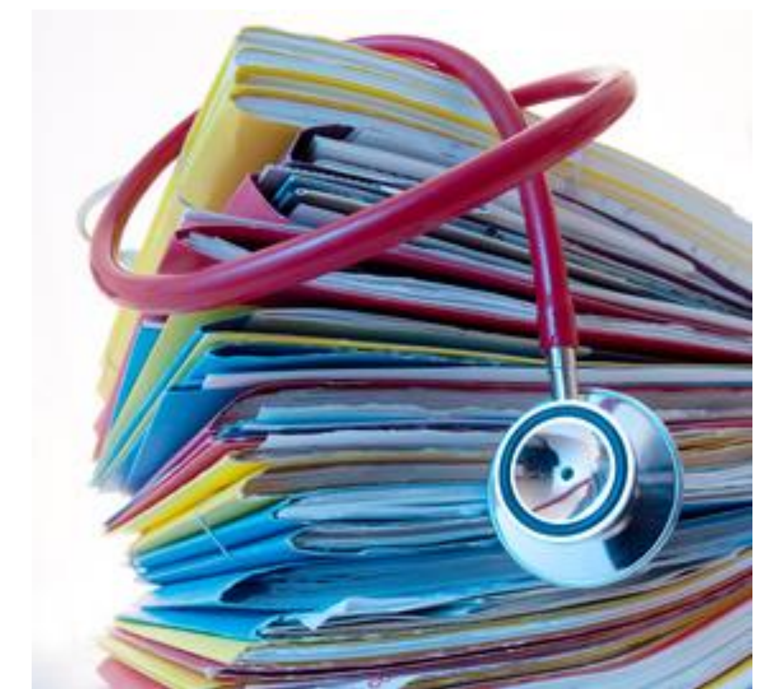
Image 3: Des dossiers psychiatriques nous ont donné accès à de l'information pertinente et importante!