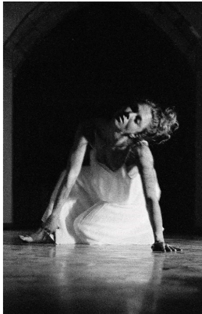
Figure 3 – Établir une nouvelle esthétique de relation avec la danse et le cosmos : quelles esthétiques m'habitent intérieurement?

« Avec la bonne posture, on fait circuler l'énergie de la Terre et du cosmos... mon corps est toujours en avance par les chemins spirituels qui sont déjà là, présents dans la corporalité. Je commence à simplement à en être consciente et peut-être même comprendre cet autre mode de connaître. Paradoxalement ce mode de connaître implique l'apprentissage du lâcher-prise par rapport à tout connaître et tout comprendre : ce mode de connaissance enseigne simultanément l'acceptation vis-à-vis le simple fait qu'il y aura des mystères au sein de la connaissance. » (2023)