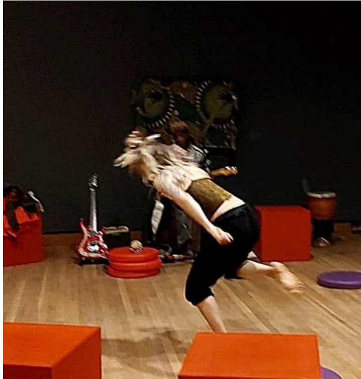
Figure 2 – Inclinaison du dos : esthétique contemporaine et héritière de sources africaines

Robinson et Domenici (2010) notent que la division hiérarchisée entre l’occident et le reste du monde s’est traduite dans la danse par une division entre les danses de ‘hauts standards’ et de ‘bas standards’, entre autres toujours présente dans la non-intégration de diverses esthétiques des danses dans les universités (Walker, 2020). Entre autres, Walker (2020) suggère que l’invisibilisation des esthétiques des danses Noires dans les institutions est une des raisons de leur manque de reconnaissance. Walker incite à rebalancer les curriculums des départements de danse en offrant un accès aux connaissances de ces esthétiques et épistémiques. En danse, l’effacement des connaissances et expressions culturelles ‘du reste’ se traduit entre autres par le mythe évoquant le ballet comme la fondation de toutes les autres danses (Hanna 1973 dans Mabingo 2019). Mills (1997) note que les danses afrodescendantes sont majoritairement jugées selon des critères