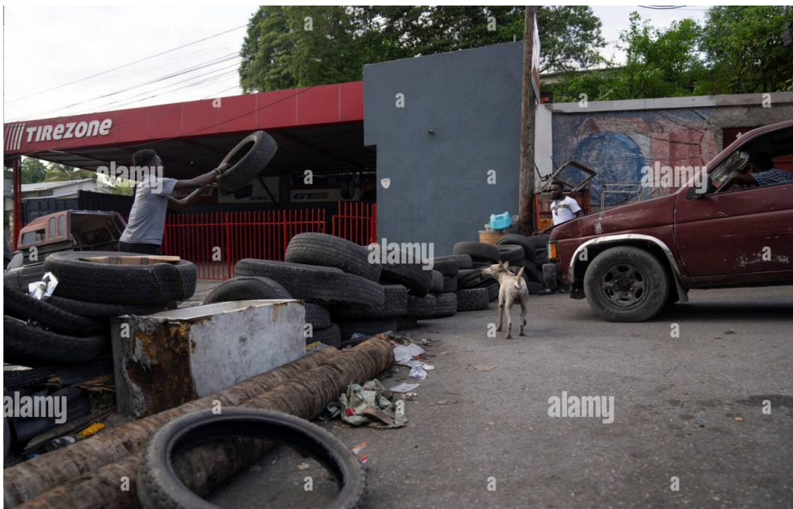
Photo 3. Barricade érigée sur la route du Canapé-Vert à la suite de bwakale