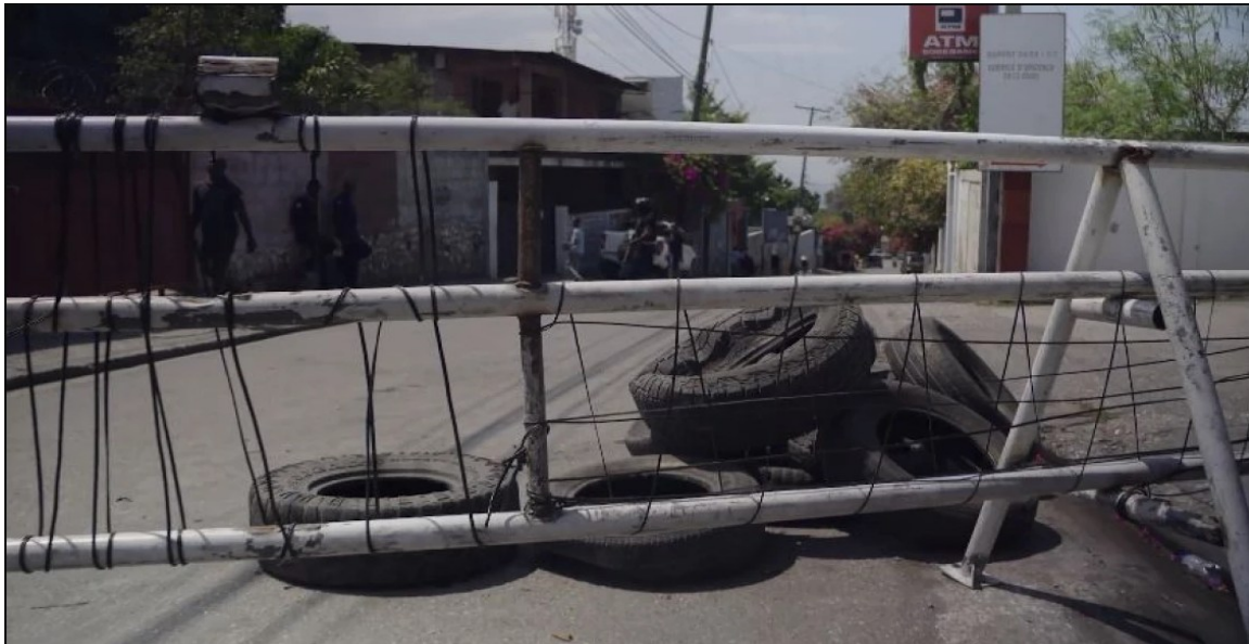
Photo 2. Barricade érigée sur la route du Canapé-Vert.