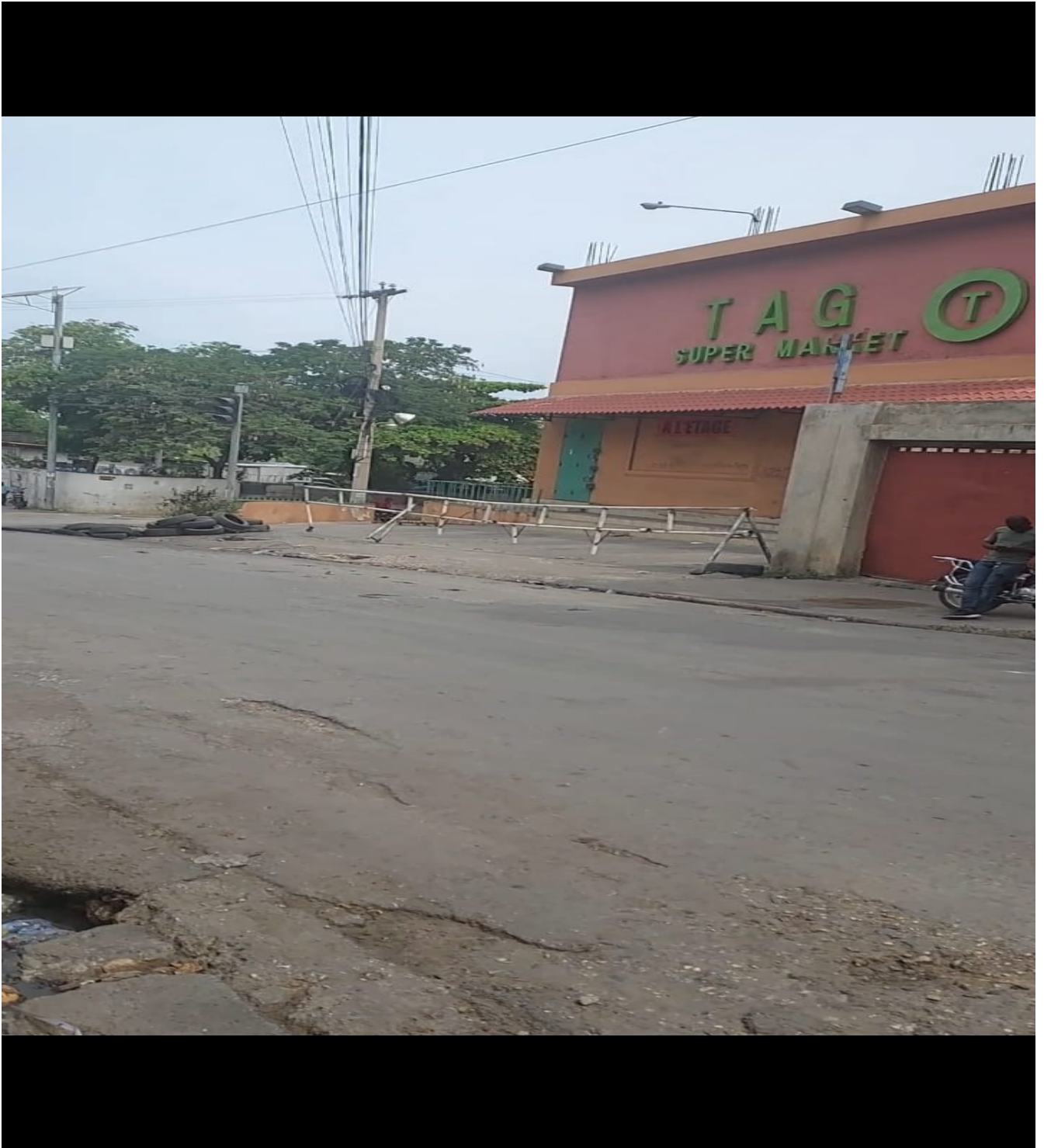
Photo 1. Barricade ouverte pour la circulation sur la rue Bois Patate