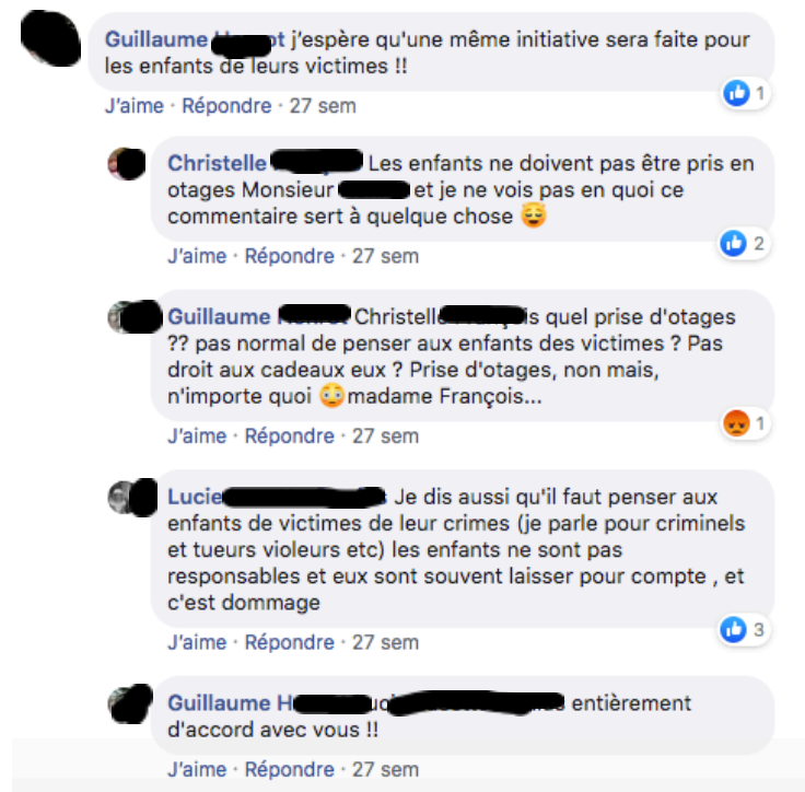
Figure 1 : Illustration