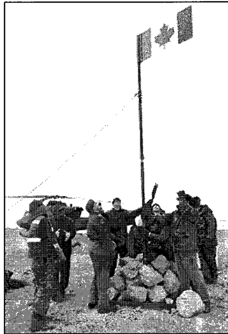
Exercice militaire sur l'île Hans

Les produits de communications du gouvernement mentionnent, bien sûr, le besoin de surveiller le territoire contesté et de maintenir une présence militaire sur celui-ci. Pour protéger (mais aussi pour mieux comprendre) les frontières, les côtes, les eaux navigables et l'espace aérien du Canada, le gouvernement a recours aux Forces canadiennes et à la technologie. En effet, quelques textes vantent les capacités dont est muni le Canada pour surveiller et défendre son territoire. Par