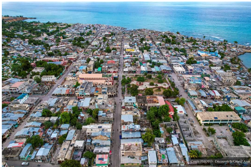
Figure 1 : Image de drone du centre-ville de Jérémie

Page Facebook Découvrir La Grand'Anse, 26 novembre 2023