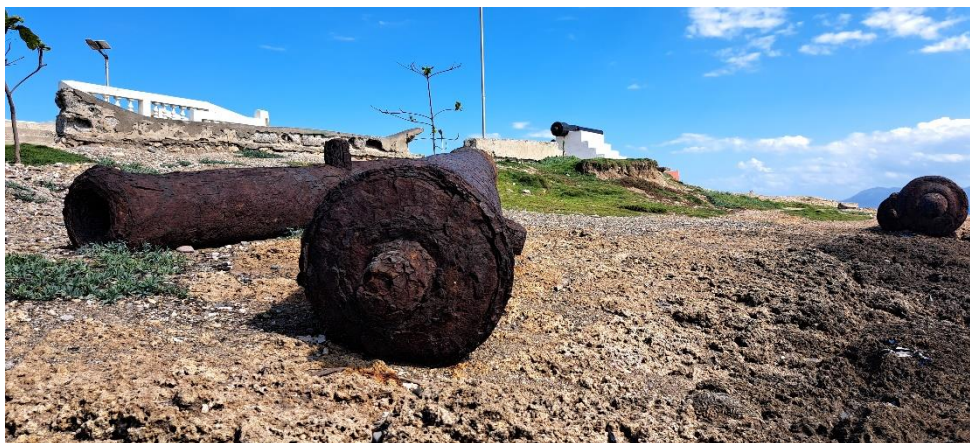
Figure 6 : Pièces de canon non réhabilitées