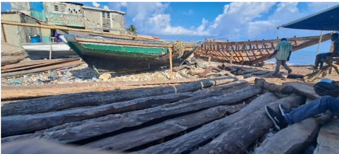
Figure 3 : Atelier de production du matériel de pêche

Source : Pierre Jameson Beaucejour, 26 février 2024