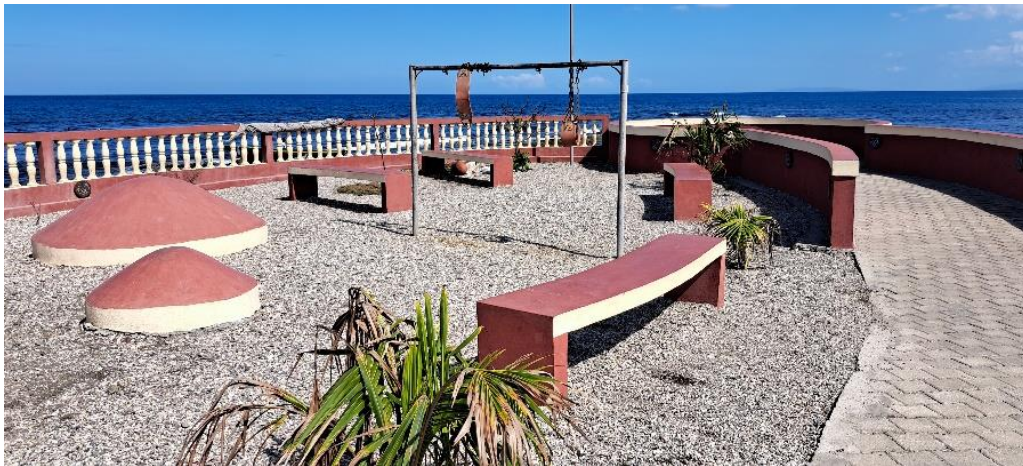
Figure 5 : Fort La Pointe après la rénovation