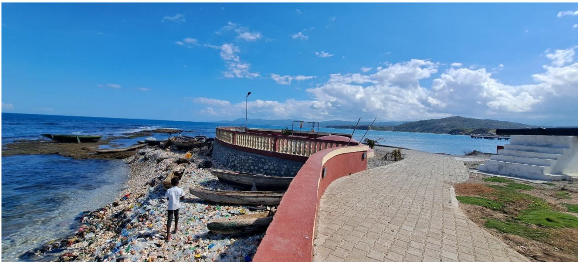
Figure 8 : Coin d'embarcation sous-coté du Fort rénové