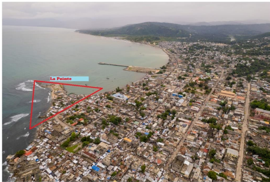
Figure 2 : Image de drone de la localisation de La Pointe