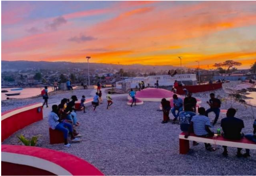
Figure 7 : Le Fort La Pointe et ses visiteurs