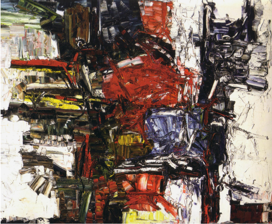
Dragon Huile sur toile 1959 249 X 295 cm