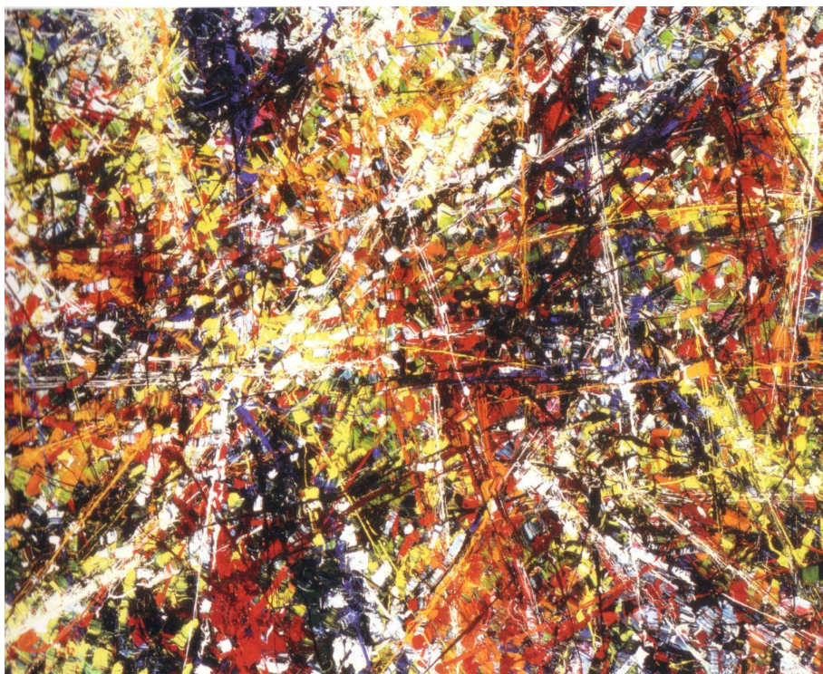
Dérive Huile sur toile 1952 130 X 162 cm