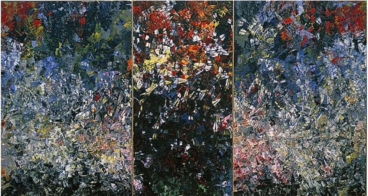
Pavane Huile sur toile 1954 300 X 550.2 cm