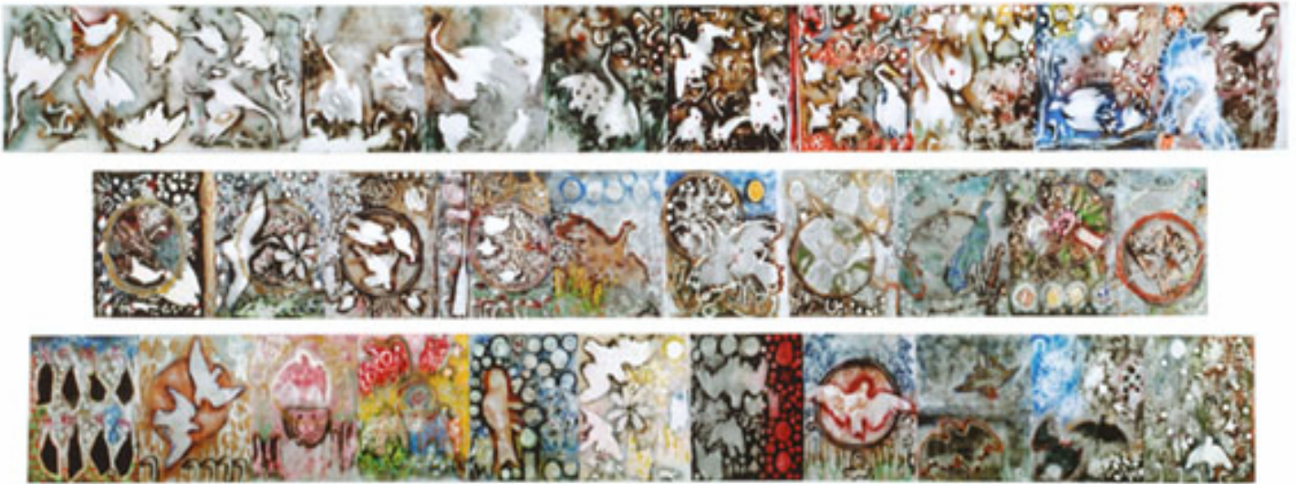
L'Hommage à Rosa Luxemburg Triptyque, 1992 Techniques mixtes sur toiles 1.52 X 42m