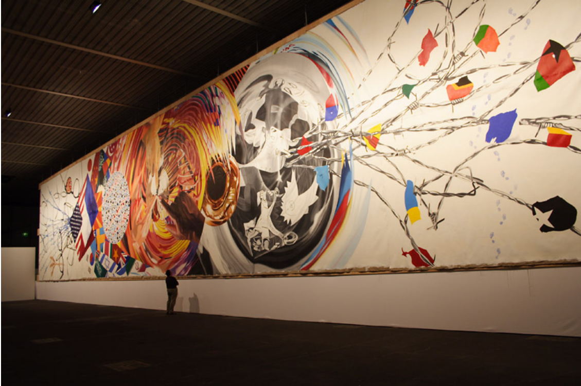
James Rosenquist Celebrating the Fiftieth Anniversary of the Signing of the Universal Declaration of Human Rights by Eleanor Roosevelt 1998 Huile sur lin belge 7.3 X 40.5 m