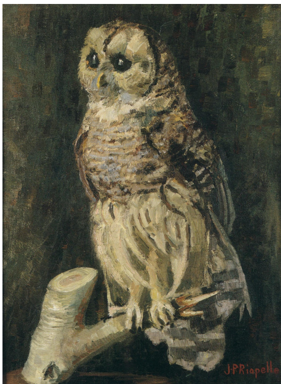
Hibou premier Huile sur toile 1939-1941 40 X 30 cm