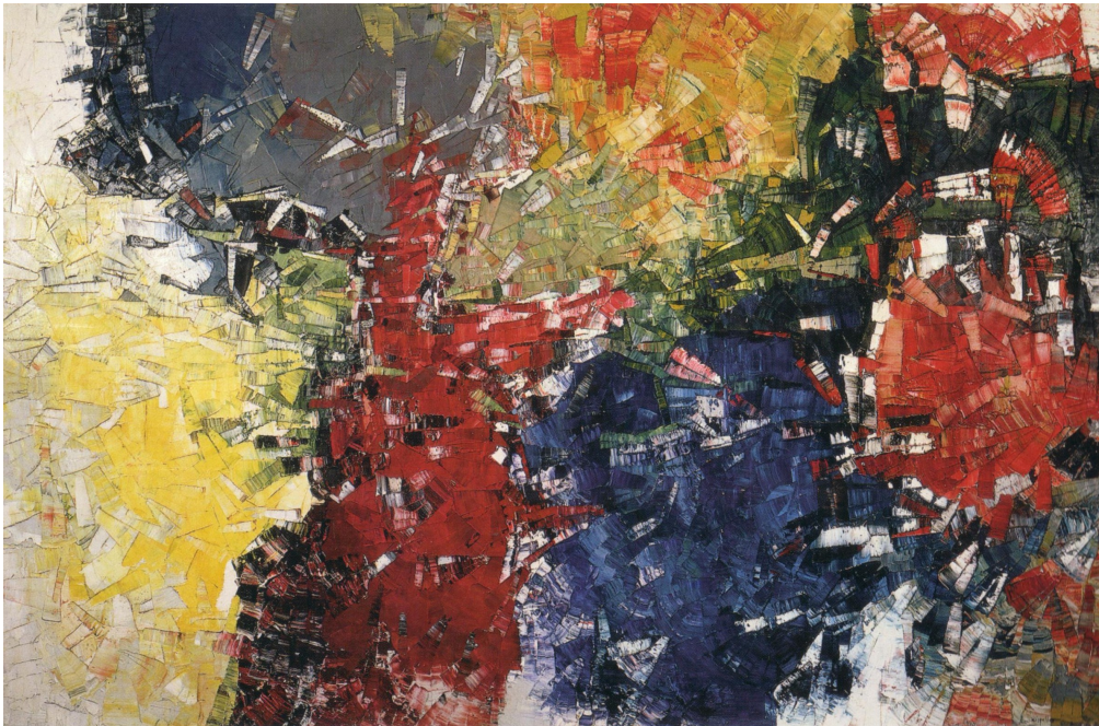
Sans titre Huile sur toile 1955 200 X 300 cm