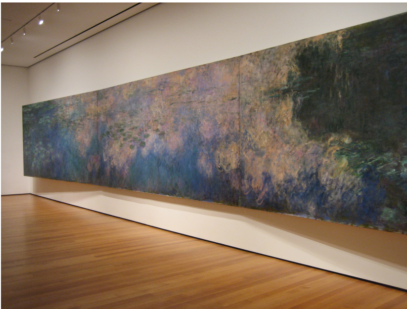
Claude Monet Nymphéas 1914-1926 200 X 1276 cm