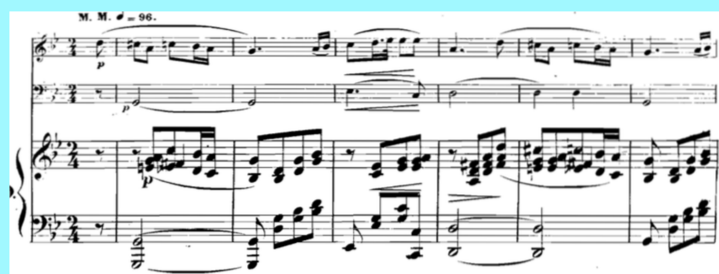
4 e mouvement, mm. 1-6: piano actif, mélodie au violon et accompagnement au violoncelle