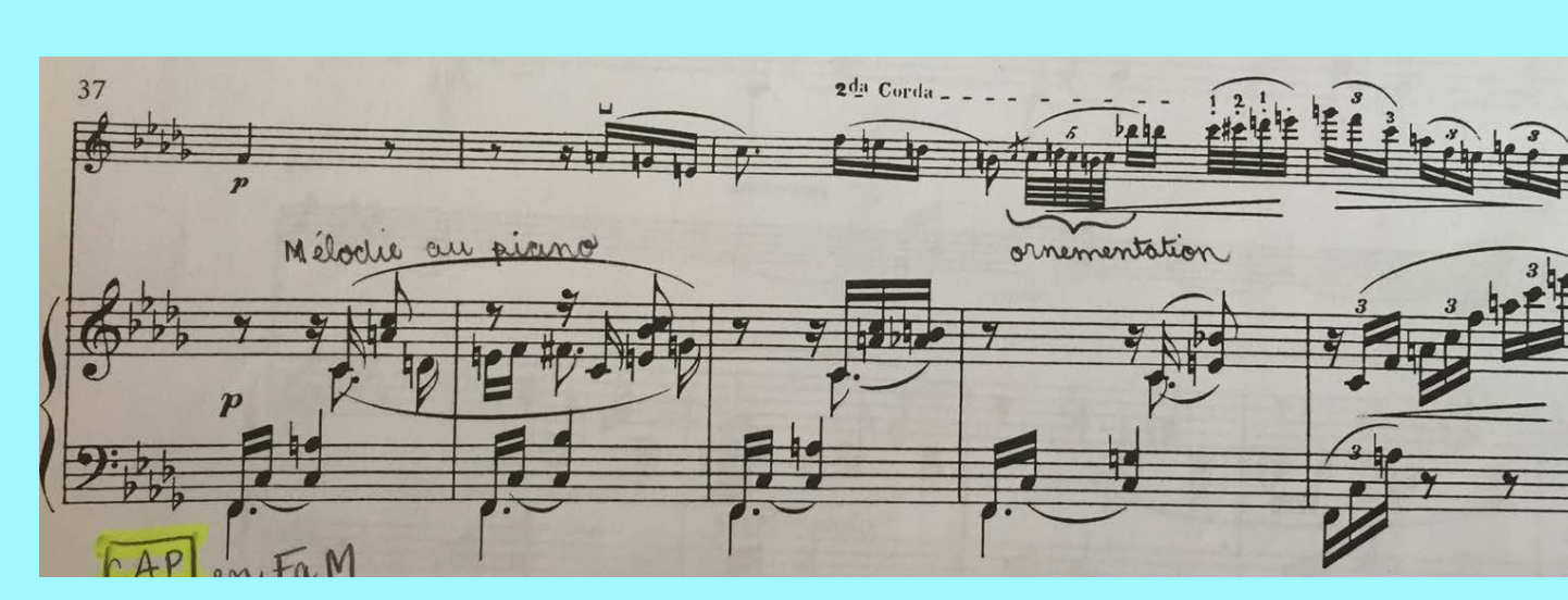
1 ère romance, mm.37-41: chromatisme, ornements, échange de la mélodie entre le violon et le piano