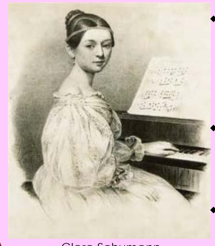
Clara Schumann (1819-1896)