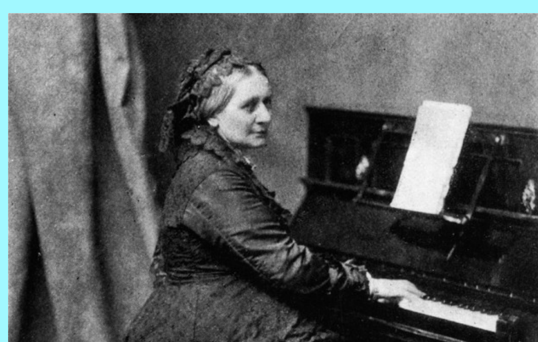
Clara Schumann (1819-1896)